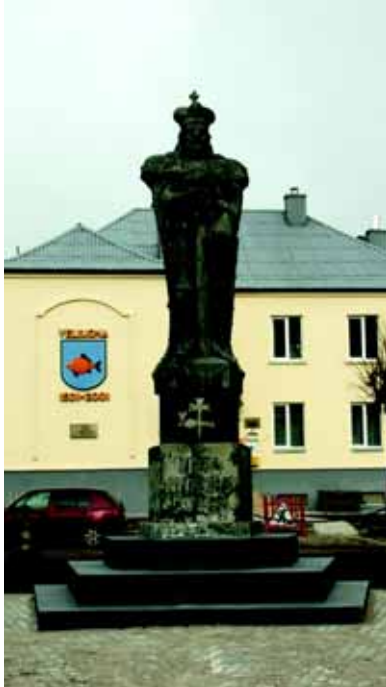
Viršuje – paminklas Vytautui Didžiajam Veliuonoje. Skulptorius A. Šimkūnas, projekto autorius V. Grybas; dešinėje – informacinis stendas „Veliuonos piliakalnis“ Veliuonos miestelyje

riją ženklinančius svarbiausius skaičius bei datus. Ką jos sako apie šį miestelį?