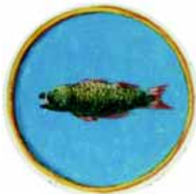
Veliuonos herbas 1791 m.

KONSTANTINAS PRUŠINSKAS