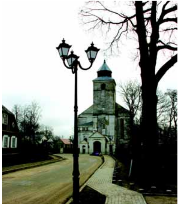
1636–1644 m. pastatyta Veliuonos Švč. Mergelės Marijos Ėmimo į dangų bažnyčia

Kraštovaizdis Veliuonos apylinkėse panašus į Seredžiaus. Grožimės juo, fotografuojame. Aplankome ir senąją Veliuonos dvarvietę. Joje išliko centrinis dvaro pastatas ir jį supantis parkas. Pastatas pusiau mūrinis, pusiau medinis. Dalį jo užima Veliuonos krašto muziejus. Įsipašome į vidų. Tų ekspozicijų, apie kurias gali pasiskaityti muziejų reklamuojančiuose informaciniuose leidiniuose, čia nėra. Tvarkingai sudėta ir eksponuojama tai, kas čia surinkta