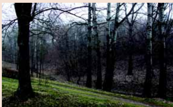
Seredžiaus piliakalnis ir jo prieigos. Nuotraukos D. Mukienės.

griovį, kuris ariant ilginiui buvo užlygintas. Toliau į rytus ir į pietus nuo piliakalnio yra buvusi papėdės gyvenvietė.