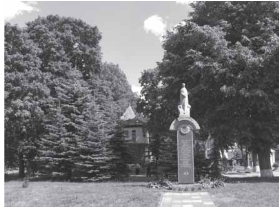
Simono Daukanto klėtėlė (Kalvių k., Lenkimų sen., Skuodo r.) ir paminklas Simonui Daukantuio Lenkimuose (skulptorius R. Midvikis, architektas – A. Skiezgelas, 1993 m.).