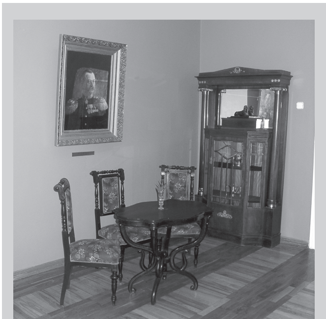
Kretingos muziejaus ekspozicijos fragmentas. D. Mukienės nuotrauka