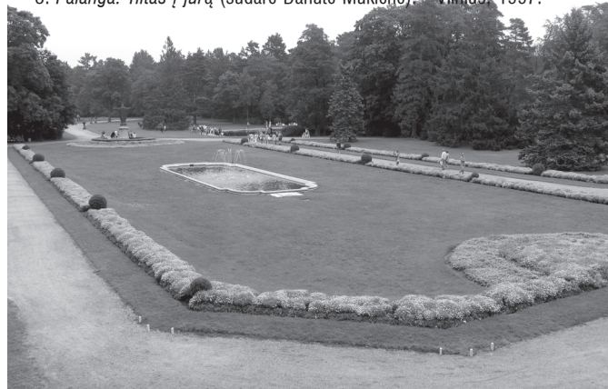
Palangos botanikos parko didysis parteris. D. Mukienės nuotrauka. 2007 m.