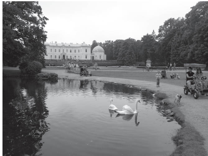
Palangos botanikos parke. 2007 m.

1961 m. J. Basanavičiaus gatvės skvere, prie pėsčiųjų tilto į jūrą, pastatyta Nijolės Gaigalaitės skulptūra „Jūratė ir Kastytis“.