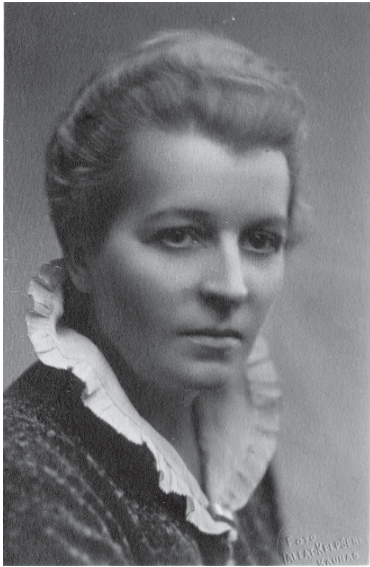
Marija Kuraitytė-Varnienė 1913 metais.