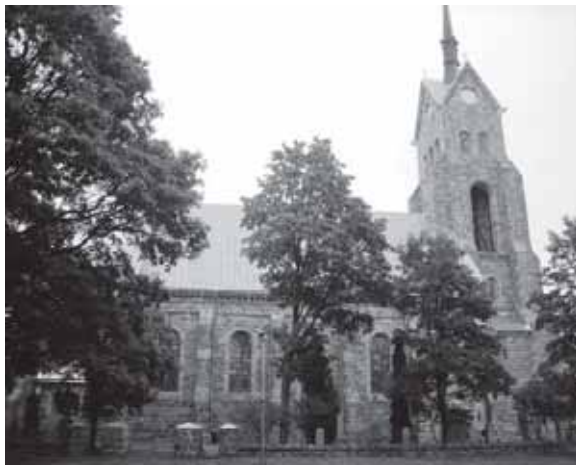
6 pav. Salako bažnyčia, 2012 metai.

Rytinė žemėlapyje pavaizduotoji ir V. Gadono aprašytoji Žemai-