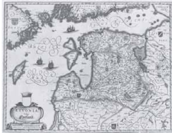
3 pav. Livonijos ir kaimyninių kraštų 1662 metų žemėlapis.