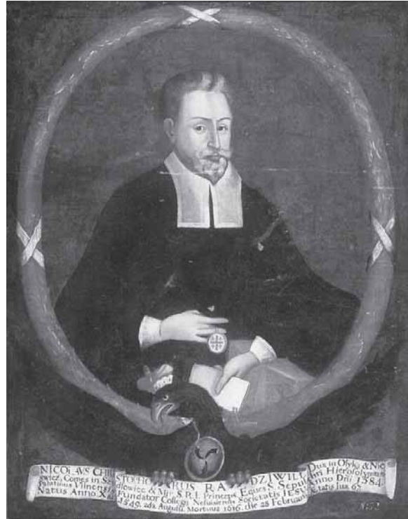
1 pav. Mikalojus Kristupas Radvila Našlaitėlis. 1730–1737 m. Dailininkas nežinomas. Paveikslas saugomas Varšuvos nacionaliniame muziejuje