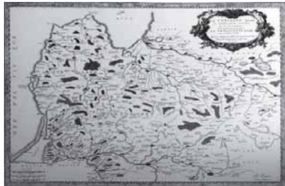
2 pav. Kuršas, Žiemgala, Žemaitija ir Lietuva N. Sansono žemėlapyje.