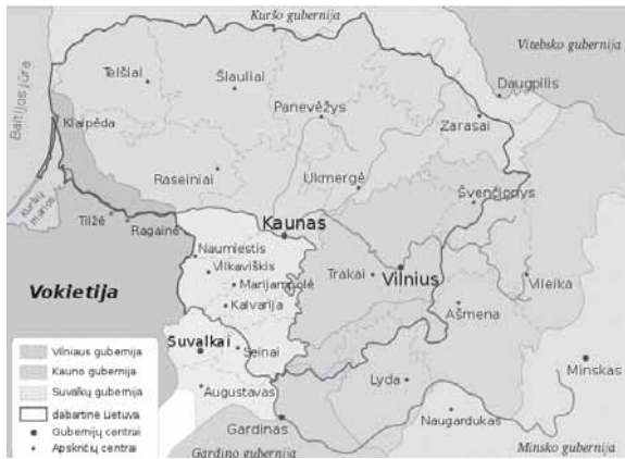
5 pav. Rusijos Kauno gubernijos ribos 1867–1914 m. Iliustracija iš B. Jankausko archyvo