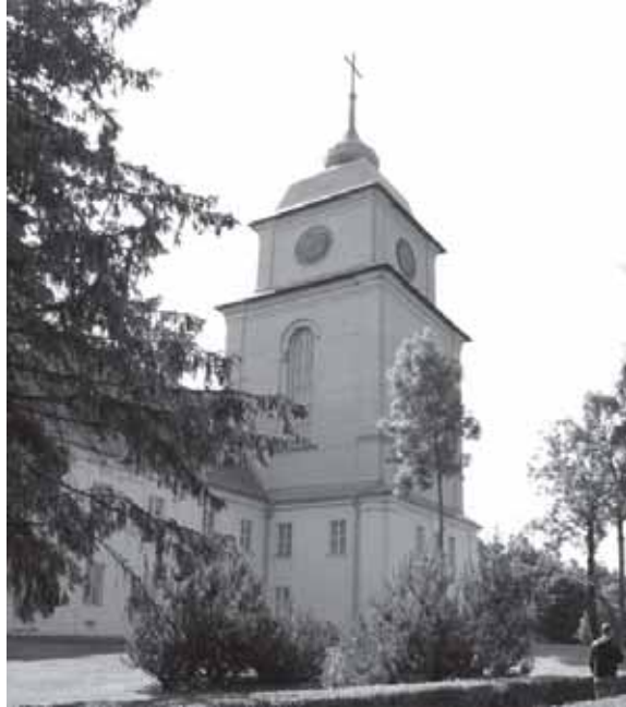
Varnių kunigų seminarijos pastatas (dabar – Žemaičių vyskupystės muziejus) Varniuose (Telšių r.). 2013 m.