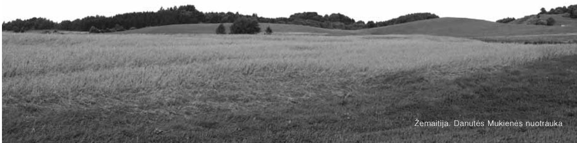
Žemaitija.