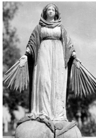
Koplytėlė, skulptūros „Kristus iš Nazareto“, „Švč. Mergelė Maloningoji“. Gargždų miestas. Fotografuota 1965 metais