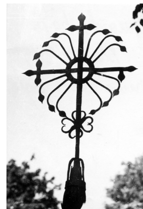
Metalinis kryžius. Gargždų miestas. Fotografuota 1965 metais

Taip baigėsi Gargždų dvaro istorija. Šiandien ją mena istorijos šaltiniai, buvusio dvaro šeimininko ženklais pažymėti, plačiai pasisklidę daugiau ar mažiau vertingi kultūros