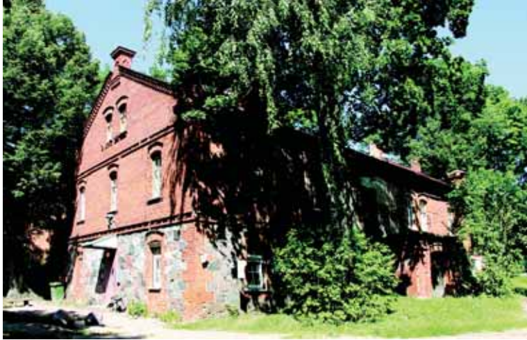
Danutės Mukienės nuotraukose – Lentvario dvaro sodybos vaizdai