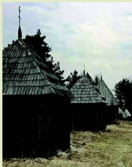
Berboras.