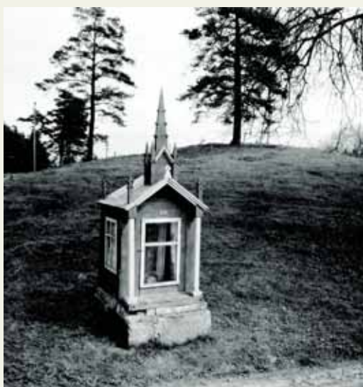
Berboro (Plungės r.) koplytėlė. Fotografuota 1989 metais