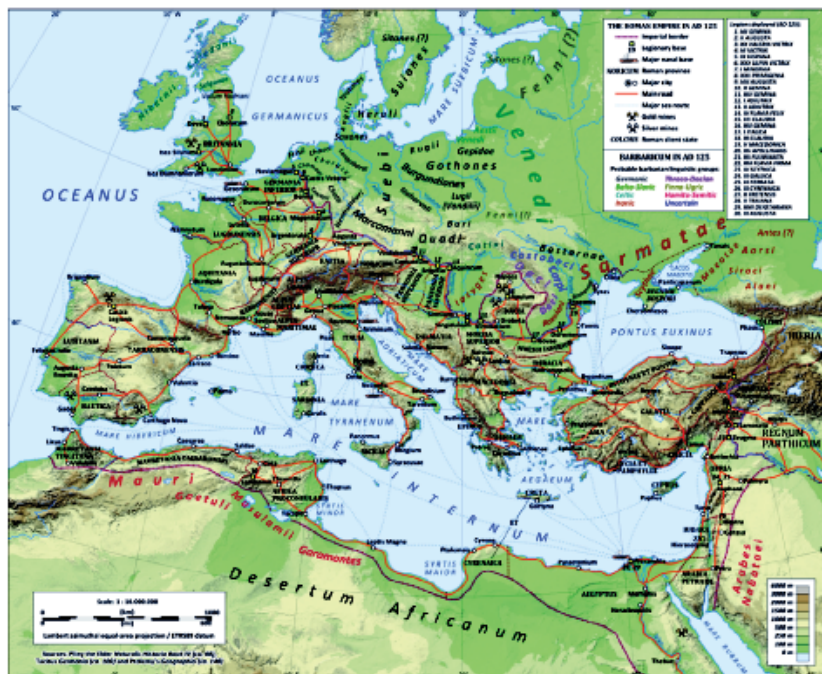
7 pav. Barbarai ir Romos imperija 125 metais /13/