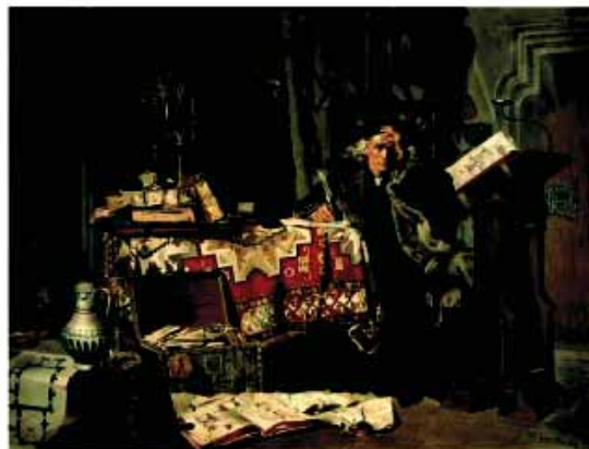
2 pav. Lenkų istorikas Jonas Dluogoėas, vienas pirmojė iėdėstęs romėniėkājā lietuvių kilmės teorijā /16. XIX a. nepinomo dailininko kūriny.