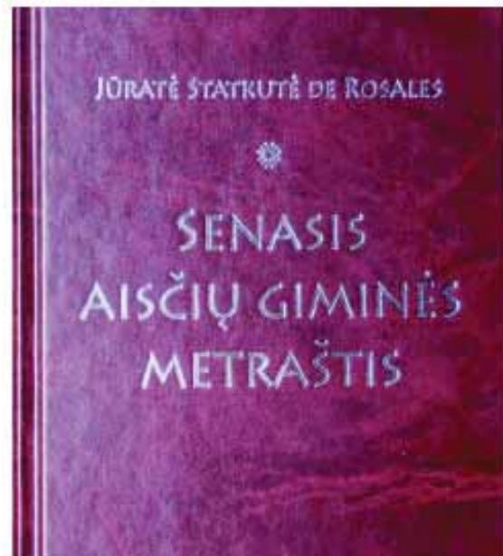
4 pav. Jūratės Statkutės de Rosales knygos „Senasis aisėių giminės metraštis“ viršelis

Dar norisi atkreipti dėmesį ĩ „EurAtlas“ tinklalapio skelbiamus Europos istorinius pėmelapius, kurie, beje, apima laikotarpį tik nuo 2 000 metų /10/. Pirmaisiais mūsų eros metais (Year 1) arėiausiai Baltijos jūros (Mare Subicum) dabartinėje Lenkijos teritorijoje parodyta pietinių germanų gentis Scirii, o ĩ pietryčius nuo jos – Veneti (iki 500 m. imtinai pavadinimai pėmelapiuose rodomi lotynų kalba). Tarp 100 ir 400 metų (kas đimtmetą) maųdaug toje pat teritorijoje rodomi Venetai, o Sarmatai (Sarmatae) su dar điauriau nuo jų esanėiais