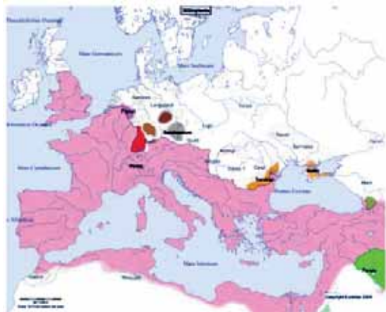
5 pav. Europos istorijos pėmelapis 300-aisiais mūsų eros metais /10/

Navarais (Navari) atsiranda điauriau Azovo ir Juodosios jūrų (5 pav.).