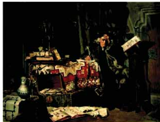
2 pav. Lenkų istorikas Jonas Dlužočas, vienas pirmųjų išdėstęs romėniškąją lietuvių kilmės teoriją /16. XIX a. nepinomo dailininko kūrinys.

Po kunigaikščio Palemono mirties trys jo sūnūs pasidaliję tuometinės Lietuvos pėmes ir kūrė sostines: Barkus į Nemuną šėkanėios Jūros žiotyse pasistatė Jurbarko pilį ir gavęs valdyti tą Pėmaitijos dalį, „kuri plyti nuo Jūros iki Nemuno ligi Kuršios šlankos“; Kuno arba Kunasijaus valstybė buvo ribojama Nemunu, Dubysa ir Nevėpju bei Nerimi, o sostinė pėėjoje Neries ir Nemuno santakoje buvo pavadinta Kaunu; Spera nukeliavęs gerokai į rytus ir valdė pėmes tarp Nevėpio, Šventosios ir Širvintos upių bei pastatė prie didžiulio ežero pilį ir dabar vadinamą Spera. Taip pat Julijonas Dausprungas prie Šventosios upės ant kalno labai patogioje vietoje pastatė pilį, kuri tenykščio žmonių kalba vadinta Vilkmerge, o netoli tos vietos padėjęs pamatus kitai piliai ir ją pavadinęs Dzeivaltovija /22/.