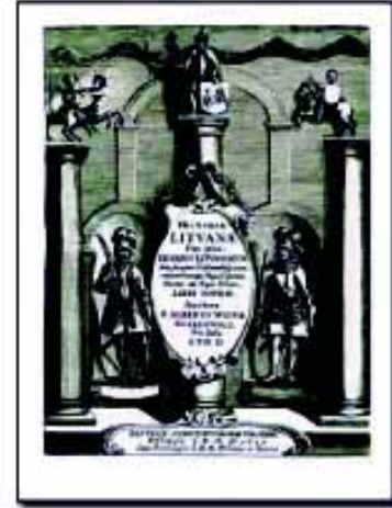
1 pav. Alberto Vėjūko-Kojelavičiaus Lietuvos istorijos I dalies titulinis lapas

Pagal A. Vėjūko-Kojelavičiaus pirmąją (todėl ir išimtinai svarbią) lotyniškai parašytą „Lietuvos istoriją“ (1 pav.) „kaipin kokie italai, pakliuvę iš Vendenų jūros į Kuršios šlanką, o iš ten prie Nemuno įėjo, pateko plaukdami prieš srovę, į Pėmaitiją ir Lietuvą. ... patikimiausia, rodos, būtų manyti, kad italai į šias pėmes bus atvykę po devintojo amžiaus nuo Kristaus gimimo.“ /22/. Nurodytoji neatikėtina vėlyva data iš karto sukelia nepasitikėjimą tuo Kojelavičiaus legendiniu pasakojimu. Tarp 500 atvykusiojų buvo vadai: Palemonas arba Publijus Libonas, herbo stulpai, Julijonas Dausprungas, kurio giminės herbas Kentauras, Prosperas Cezarianas – herbo Stulpai, Ursinas bei Hektoras – herbo Rožės arba Rožynas. Atvykėliai Nemunu pasiekė Dubysos žiotis pasistatė Romanovą (Romnovą arba Romovą), vėliau tapusia vyriausiojo lietuvių žynio Krivės Krivaičio būstine. Tai kitas tiesos neatitinkantis teiginys, patvirtinantis legendinę pasakojimo kilmę. Vėliau ateiviai persikėlė per Nevėpį ir nusigavę į alaną arba lietuvių pėmes. Jie taikingai prisiderinę prie senbūvių, o vėliau kūrė bendrą valstybę /22/. Mirus lietuvių valdovui, Palemonas bendru balsavimu buvo išrinktas