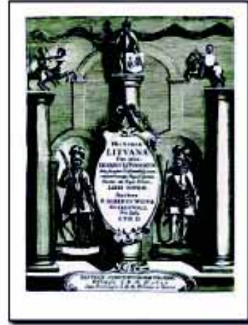
1 pav. Alberto Vijūko-Kojelaviėiaus Lietuvos istorijos I dalies titulinis lapas

Lietuvos ir Pėmaitijos valdovų. Palemono laikais vykęs atmintinas mūdis, kuriame rusai sumuė Jotvingius. Ėi tauta, lietuvių kaimynė ir sājunginikė, po daugybės pergalingų karų su rusais pagaliau buvusi āveikta Vladimiro, laimingiausiojo iš Kijevo kunigaikėiė: ji tapusi pavergta, praradusi laisvę ir kasmet turėjusi mokėti duoklę /22/.