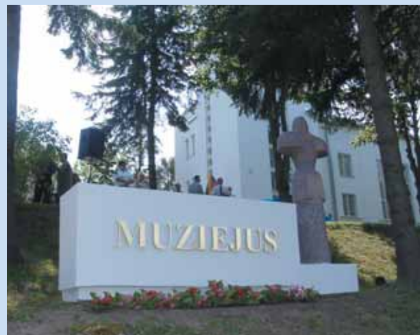
Žemaičių muziejus „Alka“ (Telšiai).