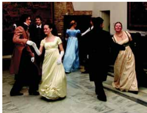
ėoka jaunimo visuomeninio susivienijimo „Historika“ (Minskas) jaunimas M. K. Oginskio laikotarpio ėokius.

12. parengti ir ėgyvendinti Lietuvoje saugomo M. K. Oginskio ir jo palikuoniė, jė artimėjė raėytinio palikimo tyrimė, skaitmeninimo ir vieėinimo programā;