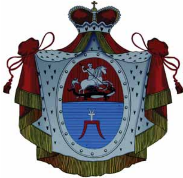
Kunigaikėieio Oginskių herbas.

2011 m. liepos 2 d. Maladeėinoje buvo priimta