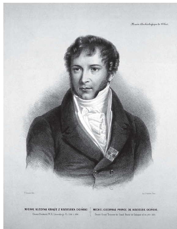
MYKOLAS KLEOPAS OGINSKIO (1768-09-25–1833-10-15) PORTRETAS. DAILININKAS FRANÇOIS GRENIER (1793–1897)

Šią rudenį, dalyvaudama UNESCO nacionalinio komiteto būstinėje surengtame tarptautinio apskritojų stalo renginyje „Dėl Mykolo Kleopo Oginskio