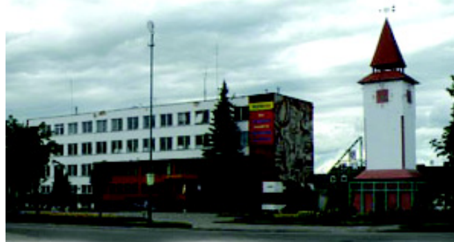
Naujosios Akmenės centras

Rajonas garsėja savo gamtiniais išteklių, kurie naudojami statybų pramonėje. Dar prieš Antrąjį pasaulinį karą Lietuvos geologai rajono teritorijoje aptiko dideles klinčių atsargas, ir čia buvo pradėta vystyti statybinių medžiagų gamybos pramonė. Rajone yra ir didžiulės kalkakmenio sankaupos. Įvertinus tai, sovietmečiu čia plačiu mastu pradėta plėtoti statybinių medžiagų pramonė. Rajone gaminamas cementas, kalkės, stogų danga.