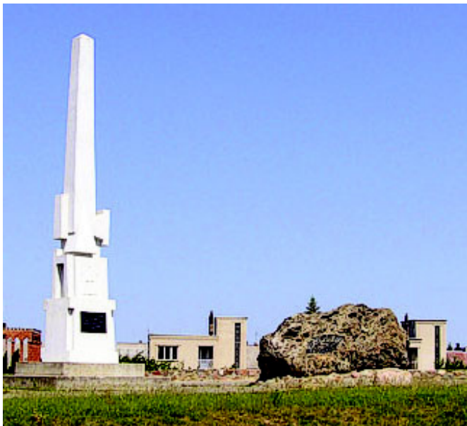
Naujosios Akmenės skvero, kuriame stovi obeliskas ir paminklinis akmuo, skirtas miesto įkūrimo 50-mečiui, fragmentas