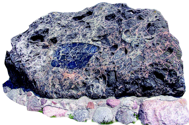
Paminklinis akmuo Naujojoje Akmenėje, skirtas miesto įkūrimo 50-mečiui

1897 m. Akmenėje buvo apie 1,5 tūkst. gyventojų.