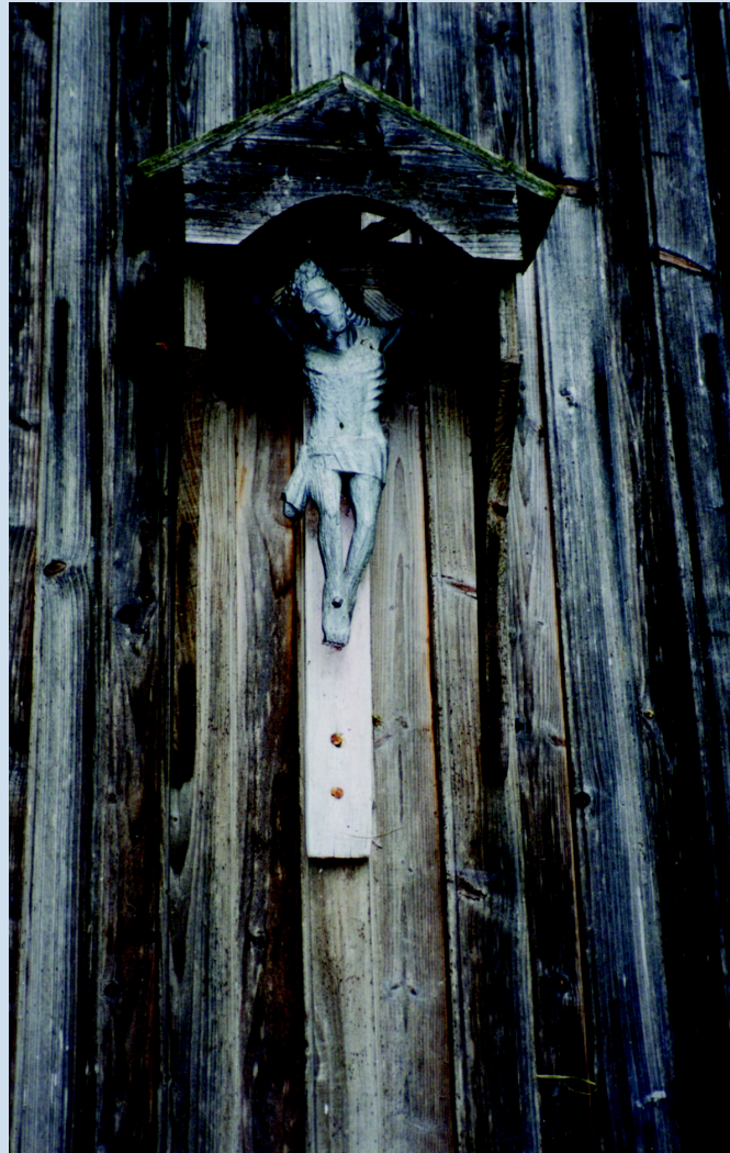
Nukryžiuotasis prie Šiaudinės Švč. Mergelės Marijos bažnyčios sienos.