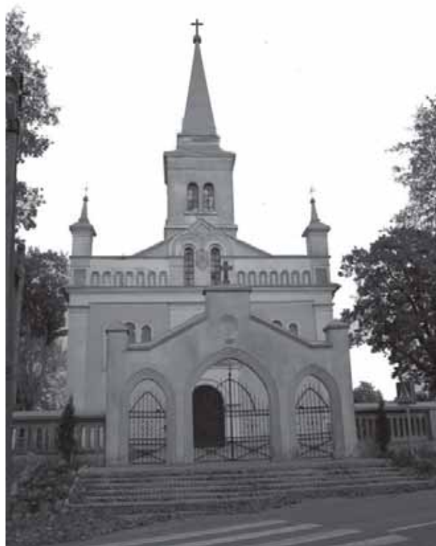
Viršuje – Žygaičių šv. apaštalų Petro ir Pauliaus bažnyčia. Kairėje nuo viršaus: Žygaičių šv. apaštalų Petro ir Pauliaus bažnyčia, Žygaičių gimnazija, Žygaičių bendruomenės pastatas ir viena iš Žygaičių gatvių