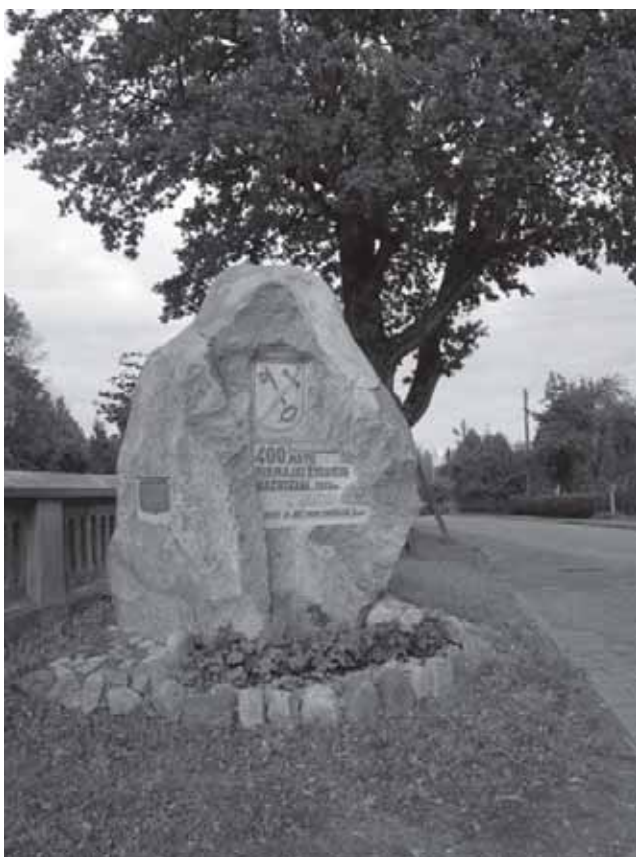
Nuotraukose: koplytėlė-paminklas Šventųjų 1934-ųjų metų atminimui Žygaičių katalikų bažnyčios šventoriuje, paminklas pirmosios Žygaičių katalikų bažnyčios vietoje ir Žygaičių miestelio kryžiai

Žygaičiuose paskutiniaisiais metais nuolat gyvena apie 700 žmonių.