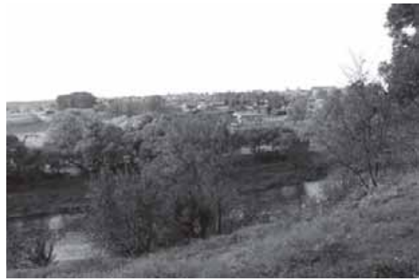
Tauragės miesto apylinkių vaizdas nuo Jūros upės pusės