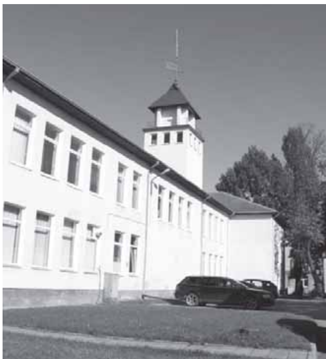
Tauragės gairinės pastatas