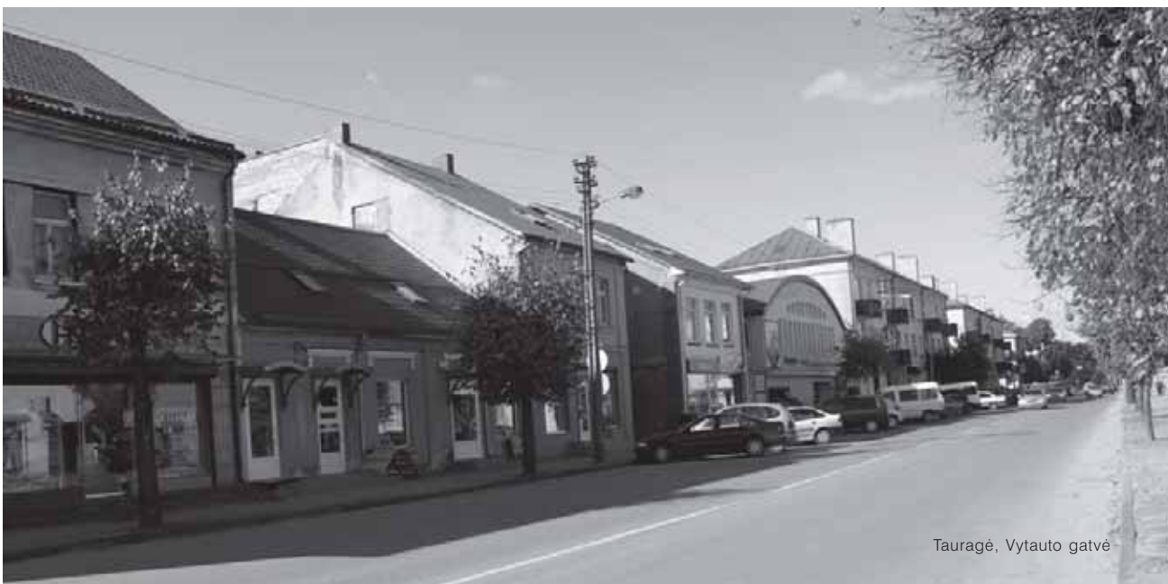
Tauragė, Vytauto gatvė