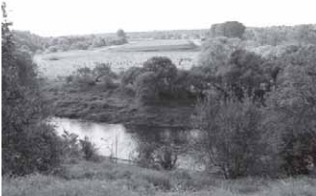
Tauragės miesto apylinkių vaizdas nuo Jūros upės pusės