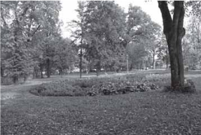
Tauragės miesto parko prie Tauragės evangelikų liuteronų Martyno Mažvydo bažnyčios fragmentas

yra veikusi muitinė, kalėjimas, psichiatrijos, apskrities ligoninė. Dabar pastatų kompleksas naudojamas kultūros reikmėms, čia veikia krašto muziejus. Pilies ansamblis užbaigtas suformuoti 1886 metais.