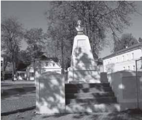
Centrinis Tauragės miesto skveras