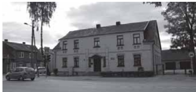
Vienas seniausių Tauragės mūrinių pastatų (iškilio 1921 m.). Tai buvusi žydų pradžios mokykla Nr. 4. Po Antrojo pasaulinio karo čia veikė suaugusiųjų, muzikos mokykla, dabar – prokuratūra

1830 m. Tauragėje pradėjo veikti odų išdirbimo įmonė.