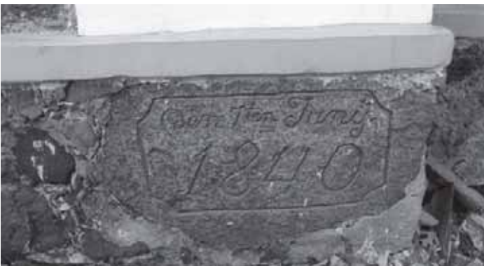
Dešinėje – Tauragės evangelikų liuteronų Martyno Mažvydo bažnyčia ir Martyno Liuterio (1483–1546) skulptūra bažnyčios nišoje. Viršuje – bažnyčios statybos data, įamžinta pamatuose įmūrytame bažnyčios kertiniame akmenyje