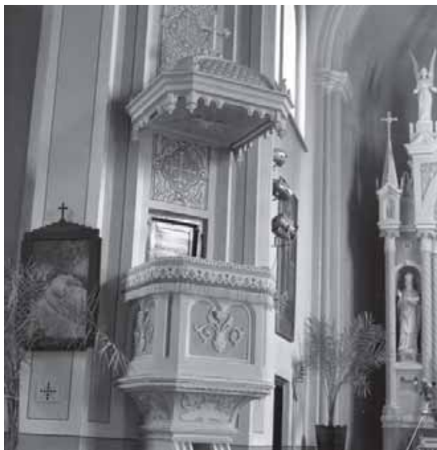
Tauragės katalikų bažnyčios altoriai. 1966 m.

Dalis Tauragės ir jos apylinkių gyventojų dalyvavo 1863 m. sukilime. Tuo laikotarpiu Tauragės apylinkėse veikė Boleslovo Jablo-