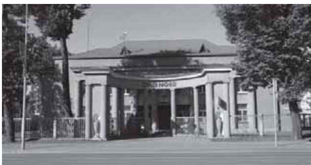
Tauragės banko pastato priekinis fasadas (architektai A. Funkas ir M. Songaila, pastatytas 1935 m.)

Miesto pavadinimas sudėtas iš dviejų žodžių – tauras ir ragas. Senovėje šiose apylinkėse plytėjo didžiuliai miškai, juose augo tau-