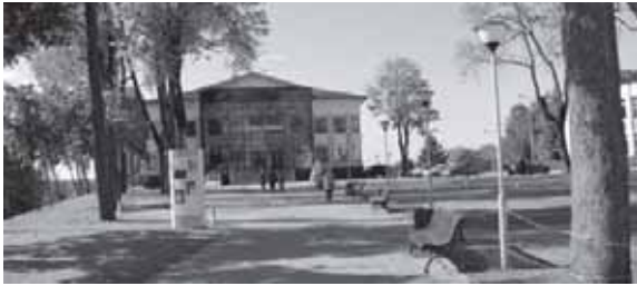
Tauragės kultūros rūmai