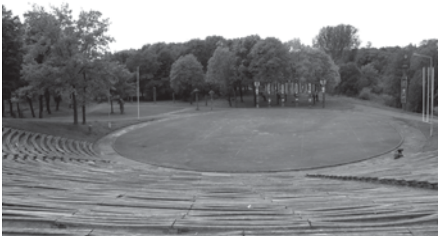
Viršuje – Tauragės miesto ligoninė nepriklausomos Lietuvos metais buvo viena moderniausių gydymo įstaigų šalyje. Jos projektą parengė architektas A. Reisonas. Apačioje – Jūros upės slėnyje įrengto Tauragės parko, vasaros estrados fragmentas

1923 m.). Ji turėjo rengti mokytojus ir Mažajai Lietuvai. Iki 1933 m. vasaros mokyklą baigė 163 auklėtiniai. 1941 m. naciai uždraudė priimti mokinius į seminarijos pirmąjį kursą, o 1942 m. seminarija buvo uždaryta.