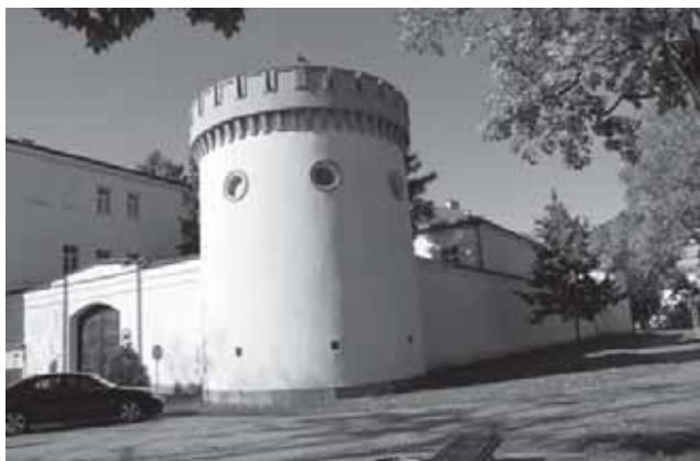
Tauragės pilies rūmų architektūrinio ansamblio (pradėtas formuoti 1844–1847 m.) fragmentas