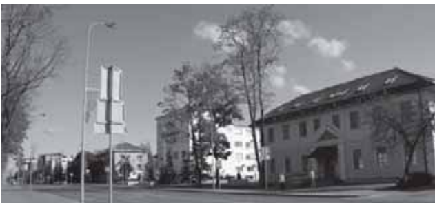
Tauragės miesto centras. Dariaus ir Girėno gatvė, senasis Tauragės paštas

XVI a. Tauragė jau buvo minima daugelio užsienio šalių rašytiniuose šaltiniuose.