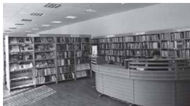
Tauragės rajono savivaldybės viešoji biblioteka