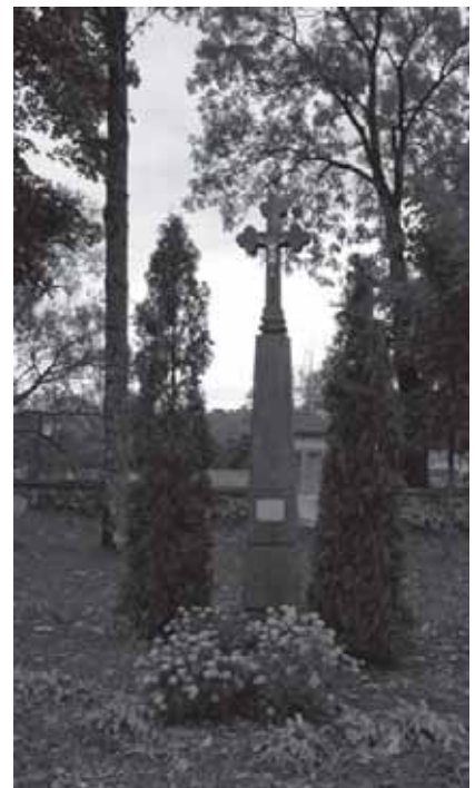
Kryžiai Pagramančio bažnyčios šventoriuje

kalnių: už 1 km – Naujininkų-Kuturių, už 5 km – Kreivių ir Matiškių, už 7 km – Reksutukų, už 8 km – Indijos, už 10 km – Dapkiškių, už 11 km – Spraudaičių, Vilkų Lauko.