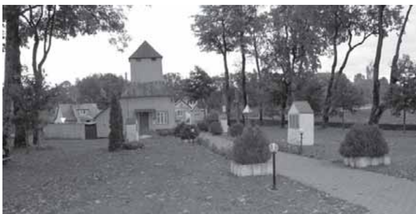
Pagramančio bažnyčios architektūrinis ansamblis, šventoriaus fragmentas