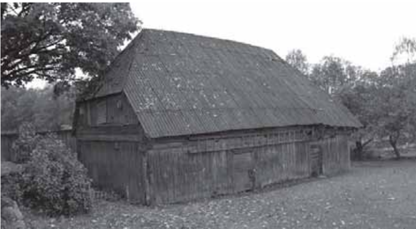
Viršuje ir dešinėje – senieji Pagramančio pastatai (viršuje – klebonija, per vidurį – buvęs klebonijos svirnas).