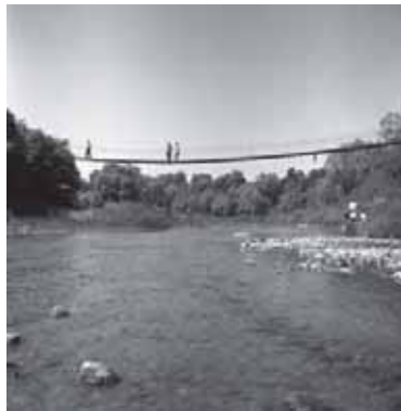
Viršuje – tiltas per Jūrą Pagramantyje. Kairėje – Pagramančio katalikų bažnyčios šventoriaus vartai. 1966 m.