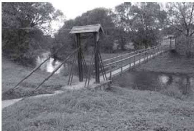
Tiltas per Akmenos upę Pagramančio miestelyje