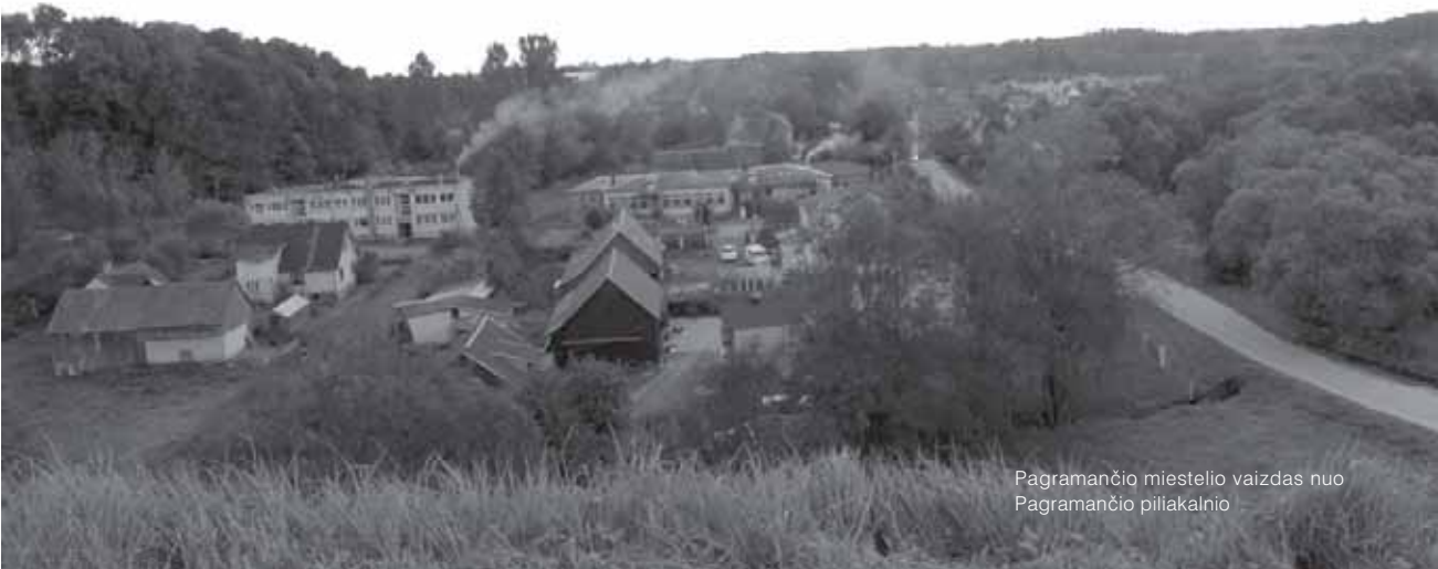
Pagramančio miestelio vaizdas nuo Pagramančio piliakalnio

Iš mažosios liaudies architektūros statinių vertingiausi yra šie: šv. Jono Nepamuko skulptūrėle Lylavėnų kaime, kopylstulpis su šv. Jono Nepamuko skulptūrėle Matiškių kaime.