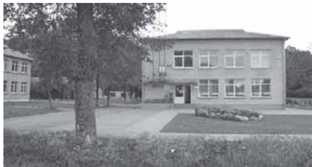
Pagramančio pagrindinės mokyklos, pašto pastatai. 2010 m.

Iš išlikusio 1784 m. bažnyčios aprašymo matyti, kad ne visos čia buvusios vertybės išsaugotos iki mūsų dienų.