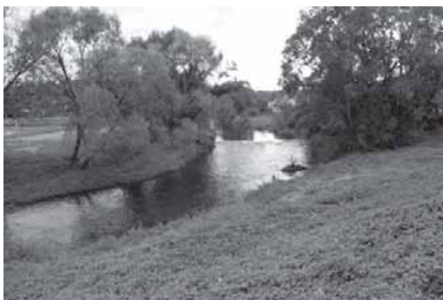
Akmenos upė Pagramančio miestelyje