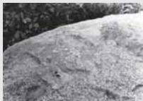
Palokysčio akmens pėdos. 1960 m.