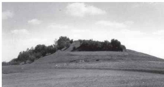
Bilionių piliakalnis. Fotografuota XX a. pirmoje pusėje

Viršuje iki šiol yra taisyklinga, beveik keturkampė aikštė su pylimo žymėmis rytiniame gale, o žemiau eina statūs penkių–šešių metrų aukščio šlaitai ir dalis išlikusios dešimties–dvidešimties metrų pločio terasos. XX a. pr. žemiau buvusios dvi gana ryškios dabar ne visai matomos terasos. Anksčiau piliakalnis priminė tarsi laiptuotą piramidę su lygia viršūne. Čia yra rasta gintarinių karolių, žalvarinis ietigalis. Iš tų radinių spėjama, kad pietinėje pašlaitėje jau žiloje senovėje yra buvę sodybų.