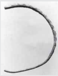
Zalvarinė antkaklė iš Dargalių kaimo