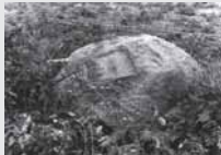
Akmuo su pėda (Palokysčio pėduotasis akmuo)