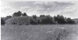
Kairėje – Vederių piliakalnio pylimas. Apačioje – Vaičių piliakalnis.