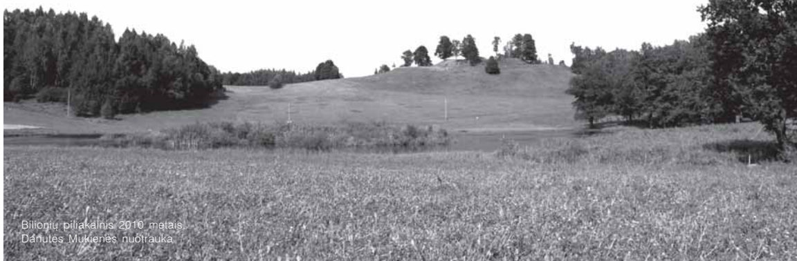
Bilionių piliakalnis 2010 metais.

Šį piliakalnių tyrinėjo ir plačiai išgarsino Liudvikas Kšivickis. Jis čia buvo iškasęs kelias nedideles duobes. Piliakalnio viršutinė aikštelė anksčiau buvo ariama. Piliakalnio šlaitas status, ant jo nebuvo galimybių užvažiuoti. Žagarus valstiečiai užnešdavę, mėslą užkeldavę kibirais, o nupjautų javų pėdus žemyn nuleisdavę virve. Žmonės seniau žinojo įvairių pasakojimų apie tą piliakalnį. Daugelis buvo įsitikinę, kad tame kalne tebėra požemiai, kuriuose ka-