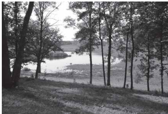
Bilonių piliakalnio papėdėje

Žmonės taip ir padarė. Kai kunigas baigė laikyti šv. Mišias, skrynja iškilo į paviršių. Po šv. Mišių reikėjo užgesinti žvakes, o jie