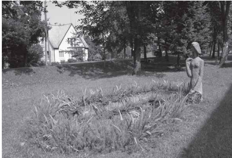
Fontano skulptūra Požerės gyvenvietėje, prie mokyklos

Visą naktį Miras blaškės, Nors žaibai ugnimi taškės. Mato... Rado jis nendryne Rūbą Tirubės lininį. Tai pro ūkanas, miglas Šaukia jį vardu kažkas. Tai per krūmus vejas raitą Miliką – pelkynų vaitą. O ryte, kai saulė kėlės, Ežeras ramiai ilsėjos. Snaudžia meldai ir nendrelės Kuždasi tarsi mergelės. Tik viena liauna nendrelė Atsiskyrus nuo būrelio. Tarsi verkė, tarsi guodė, Lenkėsi į gelmę juodą, Viršūnėle gailiai mojo – Tarsi kažin ko ieškojo.