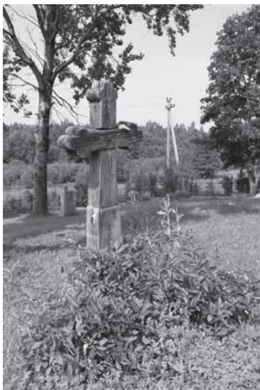
Kryžius Požerės kapinėse

Tegu atsigers vandens. Už miškų griaustinis dunda. Miras tarsi atsibunda. Patrina ranka sau kaktą Ir staiga apstulbęs mato: Ežere mergaitė braido, Bangeles žaismingai sklaido. Balto lino rūbas ilgas, O pati liauna kaip smilga. Ne, ne smilga, o nendrelė, Ežero vėsi bangelė.