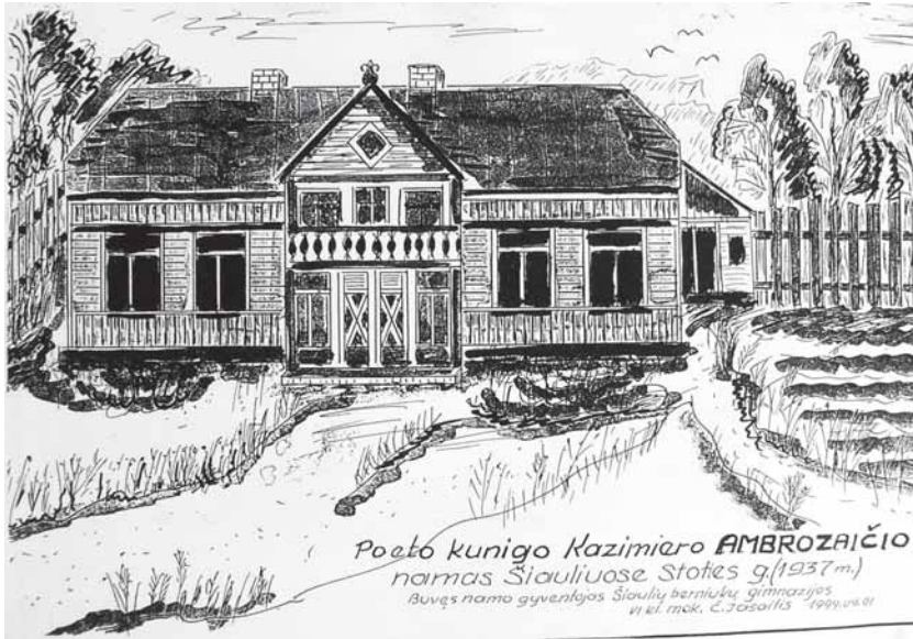
Kunigo Kazimiero Ambrozaičio namas Šiauliuose. Dailininkas Č. Jasaitis. 1994 m. balandžio 1 d.