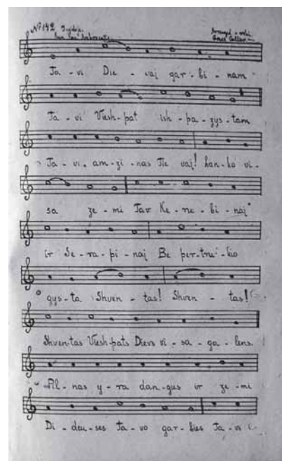
Kun. K. Ambrozaičio ingidotos „Tave, Dieve, garbinam“ fragmentas. Iš L. Bukausko rinkinio

Ėjo 1998-ieji. Baigę tvarkyti visus reikiamus dokumentus, broilai kibo į darbą. Pirmiausia begriūvančios klebonijos (tada gyvenamojo namo) vietoje pasistatė laikiną