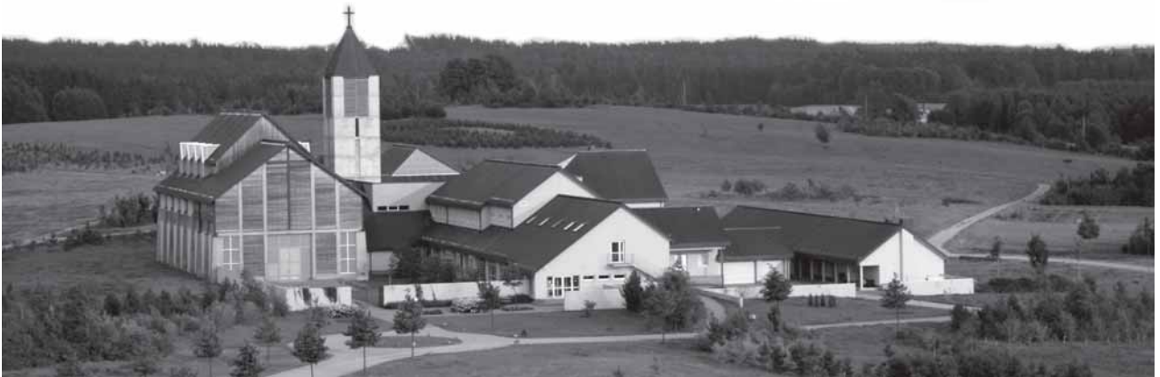
Palendrių šv. Benedikto vienuolyno kompleksas.