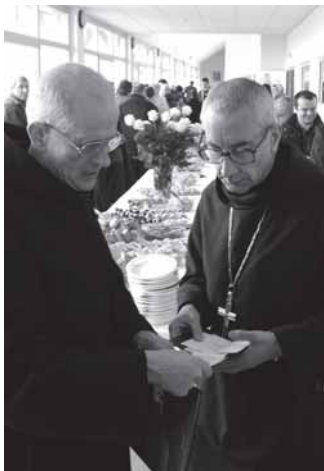
Palendrių šv. Benedikto vienuolyno gyvenimo akimirkos ir Palendrių vienuolyno kompleksas bei senoji bažnyčia (nuotrauka viršuje dešinėje).