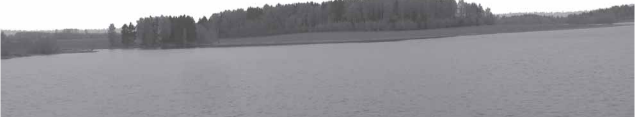
Vaiguvuos-Užventė apėlinkiu panorama