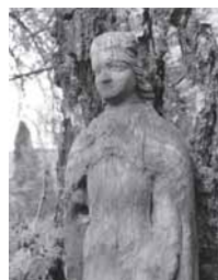
Skulptūra „Šv. Kazēmiērs” iš Žutautū kaima Budrē suodības