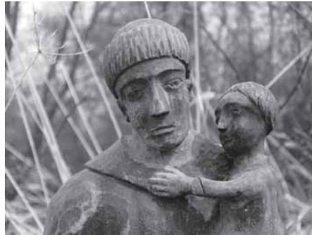
Skulptūra „Šv. Ontuons” (skulptūra iš Žutautū kaima) ēr anuos fragmentā