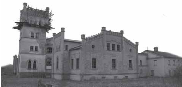
Beržėnų dvaro rūmų fragmentai 2010 m. pavasarį