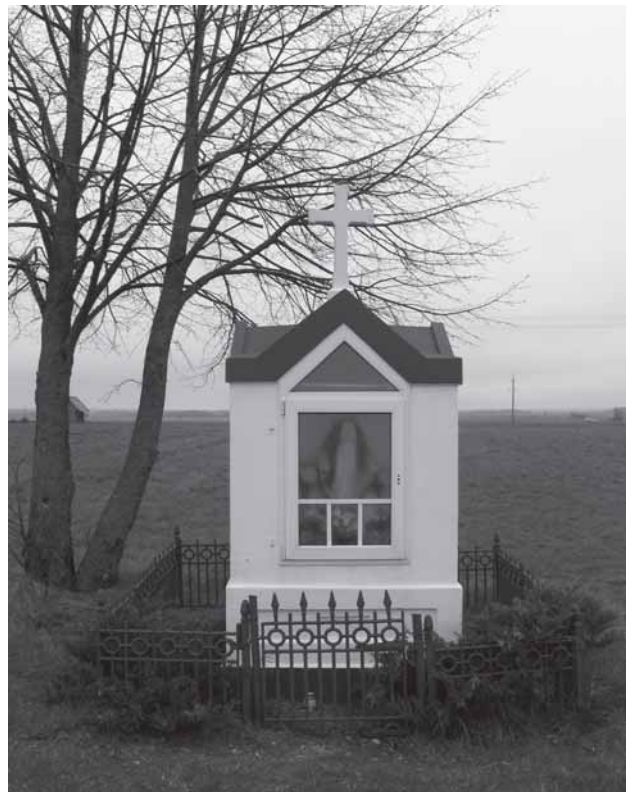
Portėgrapējuos (vėršou, iš kairies): Kristaus skulptūra Tituvienu skverė; Užvėntė parka aliejė ved i dvara pastata, katramė ĩr givėnusi rašituojė Pečkauskātė Marijė-Šatrėjės Ragana. Apatiuo: apleista suodība pri kelė i Tituvienuos ėr koplītėlė pri kelė Vaiguva-Pakievīs. 2010 m.