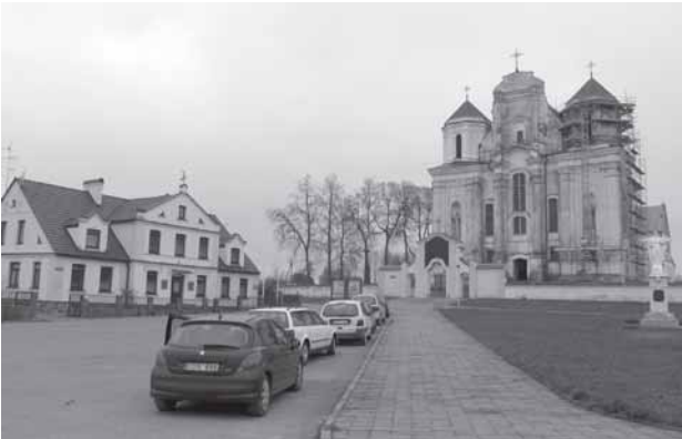
Portēgrapējuos (iš kairies): Kraži Švč. Mergelės Nekalta Prasėdiejėma bažničė ėr restaurouta Kraži kolegėjės pastata dalės. 2010 m.

toriejė kor pliestėis, jau bova besolaukonti ėr pravažioujėntiu diemėsė, bet... vėina dėina ėe nieka neblėka. Suodība greita žuoliems apejė, truoba, je dā kas ėš anuos ė bova, padėrbiejos nepraištėms „svetems“ nebovielems, vėsā ėštoštiejė ėr tik viejė par longus ėe dėina ėr nakti beūkaun. Solinka, sokėža pastatā, i katros dabar veiziedams nejostiuom anus pradedi līgintė so patėis žmuogaus givėnėmo – nelėka, kas tavi palaika, nebie i kou atsėrėmtė ėr darās tošts, i savi sosėgūžės, ligo būtomi jau niekam ė nebrėkalings.