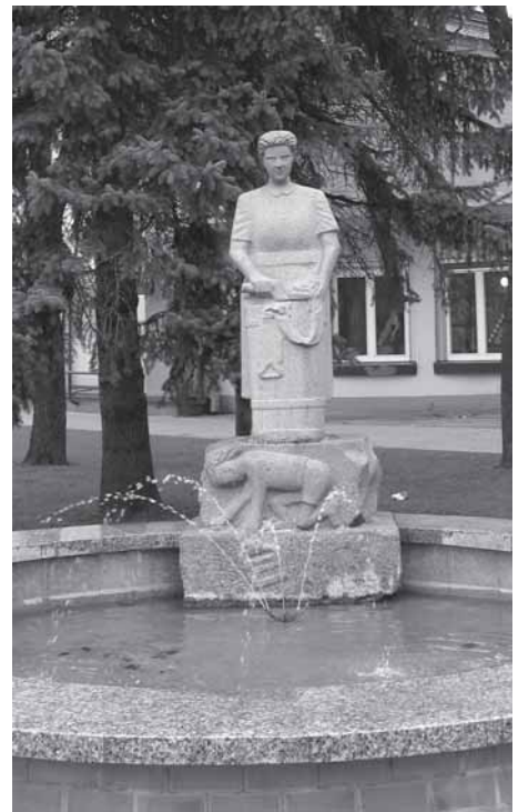
Juozas Liaudanskis. Fontano skulptūra „Skalbėja“. 1970 m., granitas. Kelmės miesto skveras

skulptūrinis dekoras, jie sumontuoti iš kelių atskirų dalių. Paminklus puošia skulptūros. Dauguma jų religinio pobūdžio, išlaikiosios liaudišką medinių skulptūrų tradiciją. Didelis dėmesys skiriamas detaliam galvos modeliavimui, ku-