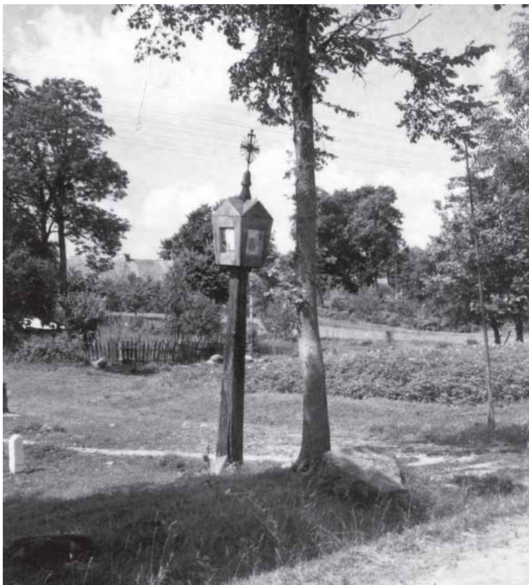
Šaukliū kaima kuoplītstolpis. Portēgrapouta 1962 m.