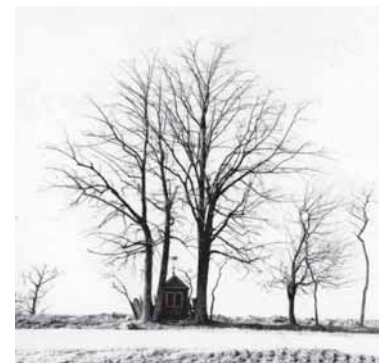
Vėršou – Vindeikiu kaima kopitėlė; Kairie – kryžios Nuotienu kaima suodibuo. Portėgrapouta 1962 m.