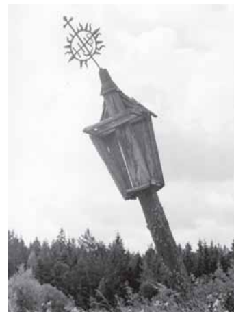
Nuotienu kapėniu kuoplītėlė; Vindeikiu kaima kuoplītėlės metalėnė vėršūnė; kuoplītėstolpis pri kelė Skouds–Lėnkėmā. Portėgrapouta 1962 m.