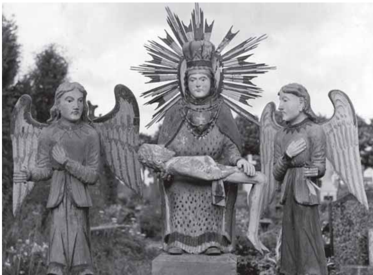
Ēš kairies: „Marijē Skausminguoji”. Šaukliū kaims. Portēgrapouta 1962 m.; skulptūrēnē grupē „Pieta”. Īlakiū kapēnēs. Portēgrapouta 1972 m.

mantizma nerasi. Veizi i tas skulptūras ēr atruoda, ka priš tavi stuov tuos žmounēs, ēšvargintē sunkiū darbū, žemēšku nelaimiu, skausma.