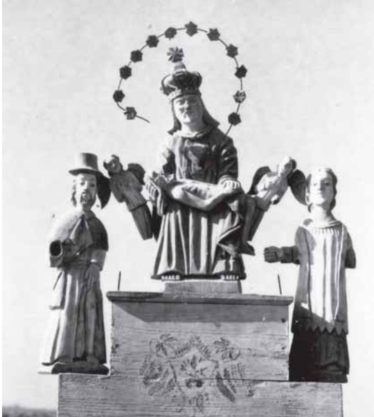
Kairie – „Pieta”. Vindeikiu kaims. Portėgrapouta 1972 m.