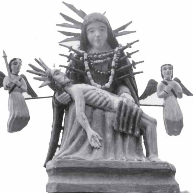
„Pieta“. Nuotenu kaims (Skouda r.). Portėgrāpouta 1962 m.