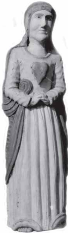
„Švc. Marijės šėrdės”. Portėgrapouta 1962 m.