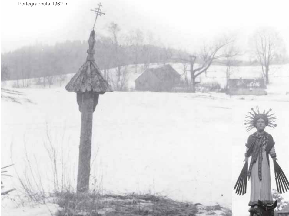
Barstitiu kaima stuogastolpis ėr Švc. Marijė Maluoninguoji”. (Nuotienu kaima skulptūra). Portėgrapouta 1962 m.

Dėl kuo ėr kas tou padarė, mums tumet nerūpiejė. Nelėka tik kuoplitelės ėr pri anuos vėituo