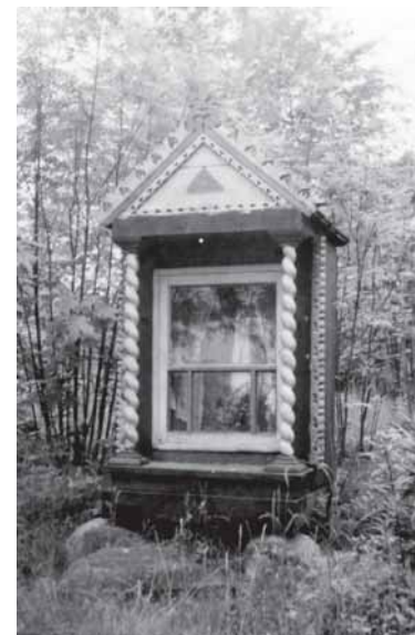
Kairie – Šaukliū kaima kuoplītēle; apatiuo – Lēnkēmu kaima kuoplītēle. Portēgrapouta 1962 m.