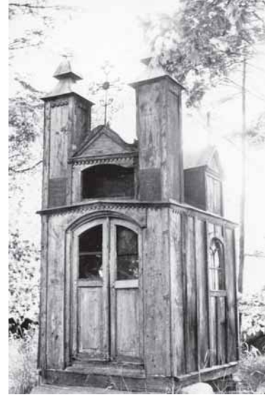
Vėršou – Šaukliū kaima koplitėlė. Portėgrapouta 1962 m.; apatiuo – Lėnkėmu mara kapieliu kuoplitėlė (pri kėlė Skouds–Darbiėnā)