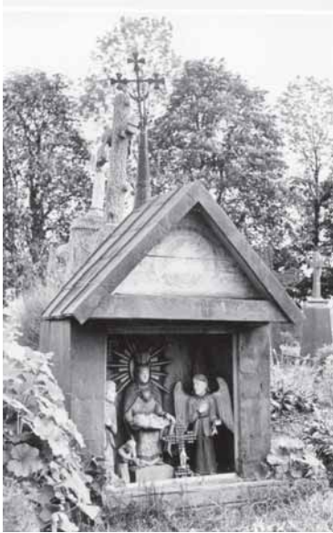
Īlakiū kapēniu kuoplītēle. Portēgrapouta 1962 m.