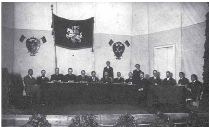
Vilniaus konferencijos prezidiumas ir sekretoriatas. A. Jurašaičio nuotrauka