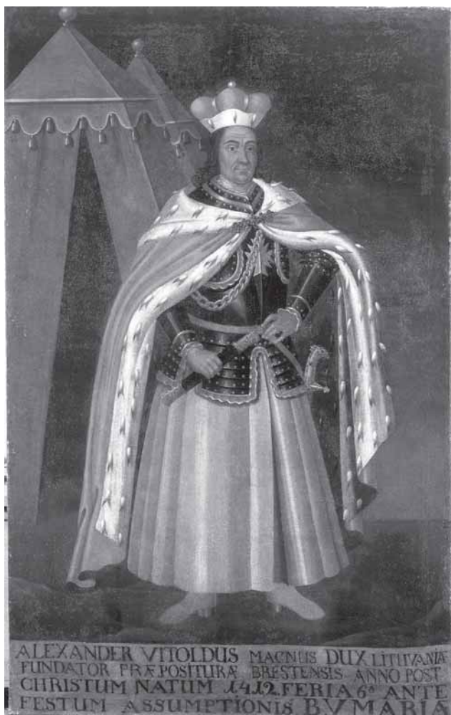
Vytauto Didžiojo portretas. Nežinomas XVII a. Lietuvos dailininkas. Kūrinyt saugomas Lietuvos dailės muziejuje.