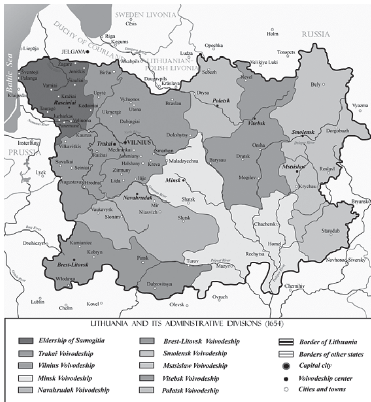
Žemaitija (viršuje, kairėje) Lietuvos Didžiosios Kunigaikštystės žemėlapyje. 1654 m.