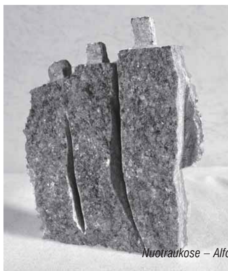
Nuotraukose – Alfonso Čepausko kūriniai