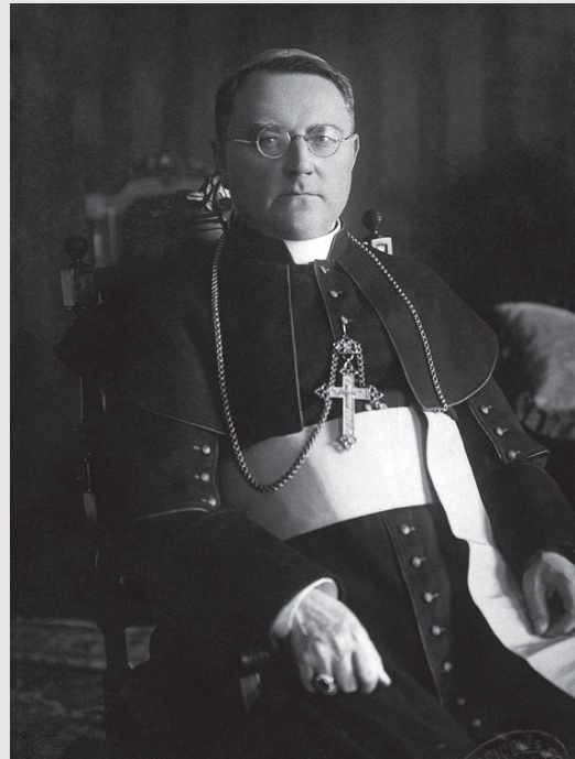
Telšių vyskupas, Lietuvos Nepriklausomybės Akto signataras Justinas Staugaitis.

Telšių vyskupas Justinas Staugaitis daugeliui Lietuvos žmonių žinomas ne tik kaip Lietuvos Nepriklausomybės Akto (1918 m. vasario 16 d.) signataras, bet ir kaip žurnalistas, visuomenės veikėjas. Gimė jis 1866 m. lapkričio 19 d. Tupikų kaime (Naumiesčio vlsč., Šakių r.). Jo tėvai buvo valstiečiai. Kelią į mokslą Justinas pradėjo 1877 m. Iš pradžių lankė Naumiesčio (dab. Kudirkos Naumiestis) pradžios mokyklą, vėliau – Marijampolės gimnaziją, o 1885–1890 m. studijavo Seinų kunigų seminarijoje, baigęs ją, buvo išventintas į kunigus. Jau seminarijos metais išryškėjo pagrindinės J. Staugaičio interesų sritys – Bažnyčios vieta tautos ir valstybės gyvenime bei katalikiški idealai ir jų puoselėjimas, sklaida.