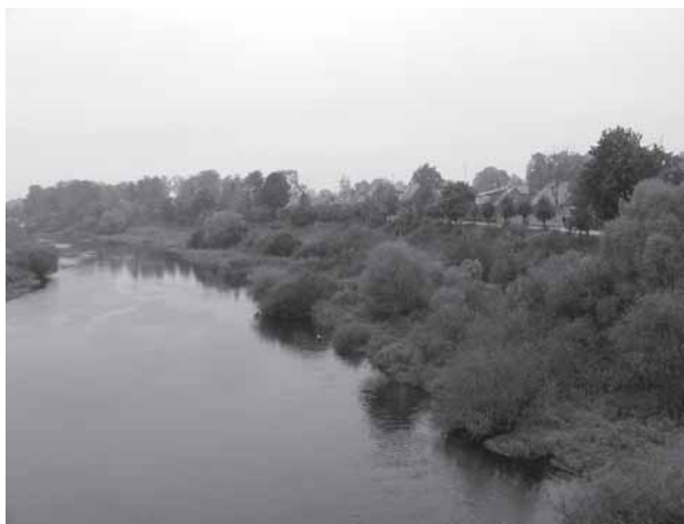
Vėikšnē (Mažėikiuo rajuons).