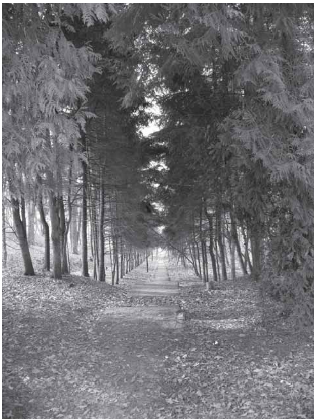
Senuojė dvara parka aleijė. Prušinskė Konstantina portegrapijė