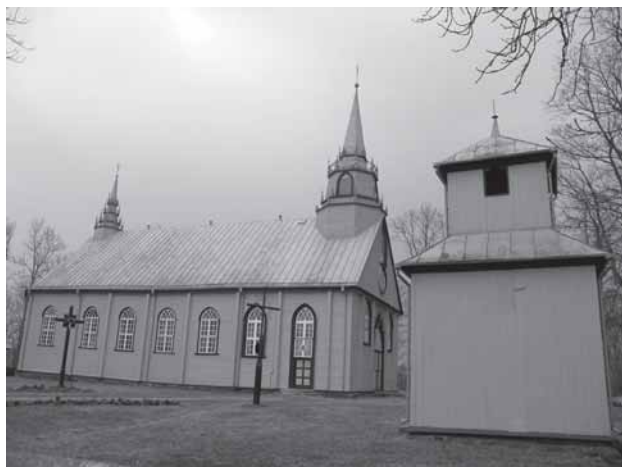
Eržvilka šv. Jorgė bažničė. Prūšinskė Konstantina portėgrapėjė