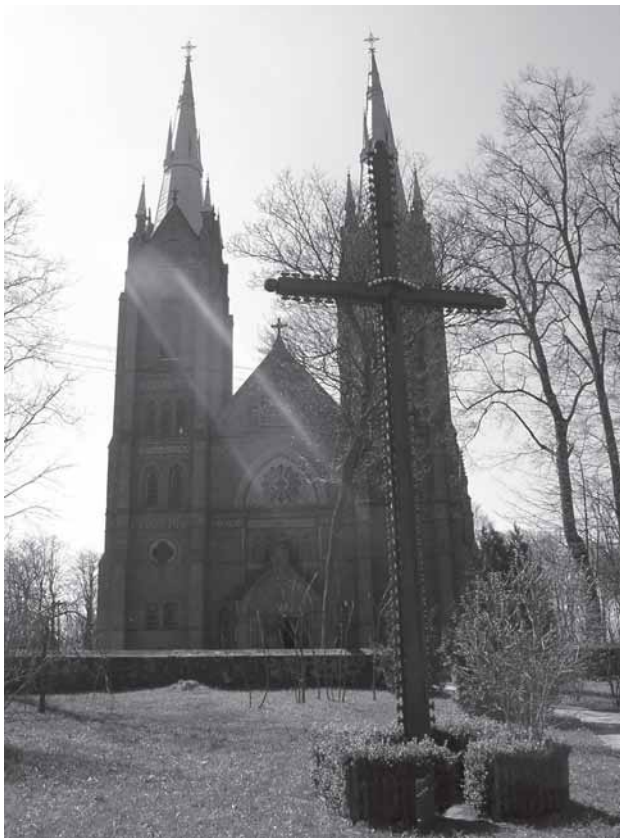
Salontū Švč. Mergelės Marijės Jiemėma i dongu bažninčė. Ramuonātės Danutės portėgrapėjė