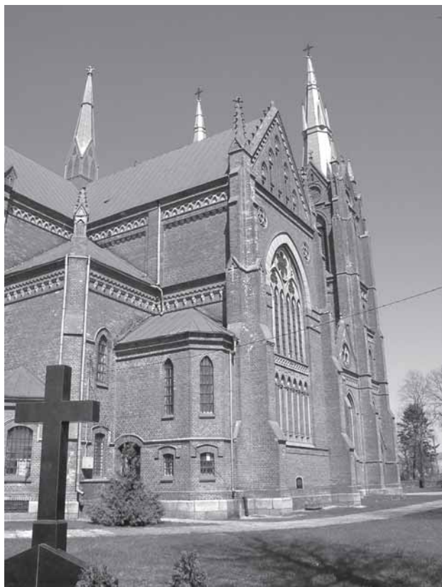
Salontū Švč. Mergelės Marijės Jiemėma i dongu bažninčės pastata fragmentis. Ramuonātės Danutės portėgrapėjė