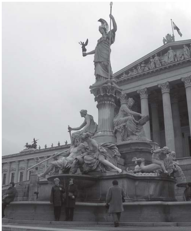
Viena (Austrija). Prie parlamento.

Oginskiai dažnai išvažiuodavo ir į Varšuvą, kur jie turėjo rūmus (stovėjo dabartinio „Europos“ viešbučio vietoje). Taip pat