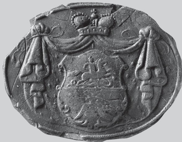
Antspaudas su Oginskių giminės herbu. LDM, MPM-608

„Palikimas – ką mums praeitis palieka, paveldas – ką mes iš praeities pasiimame ir naudojame kaip savastį, o kultūros paveldo vertybės – ką mes iš kultūros paveldo atsirenkame naudoti patys ir išsaugoti ateičiai.“