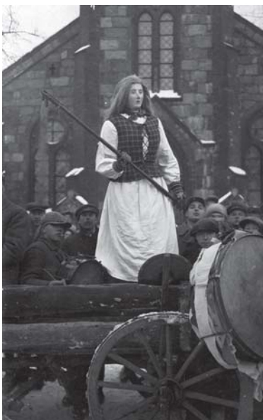
1932 m. Tūbausiuose vykusio Užgavėnių karnavalo Morė. Iliustracijos iš J. Mickevičiaus darbo „Užgavėnės Žemaitijoje“, saugomo Lietuvos istorijos muziejaus Etnologijos skyriaus rankraštyne (b. 949). J. Mickevičiui rengiant šį darbą, Morė (nuotr. viršuje) buvo saugoma Kretingos krašto tyros muziejuje, o kita Morė (nuotr. apačioje) – Šiaulių „Aušros“ muziejuje