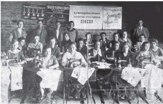
1925 m. Salantuose (Kretingos r.) vykusių siuvėjų kursų absolventai