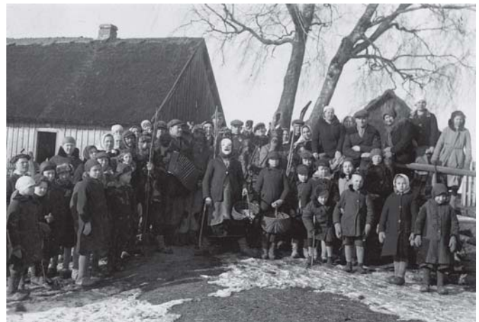
1936 m. Beržore (Plungės r.) vykusių Užgavėnių dalyviai prie fotografo Mockaus namo