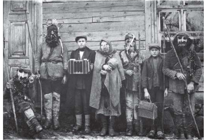
1923 m. Užgavėnių karnavalo, vykusio Salantuose (Kretingos r.), dalyviai