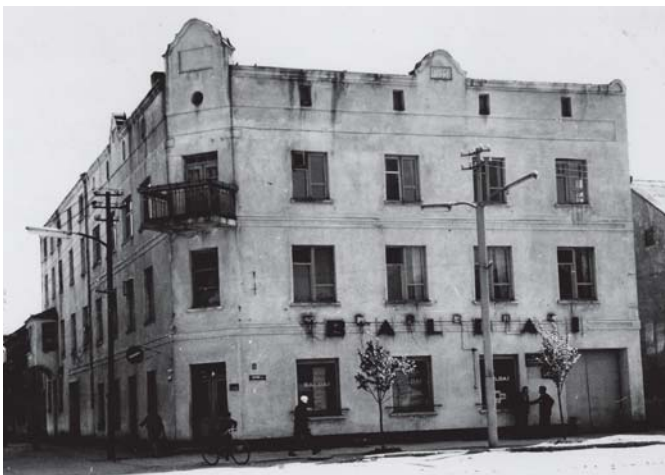
Buvusi Kretingos parduotuvė, pastatyta 1931 m.