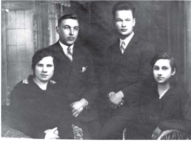
Kretingos vartotojų bendrovės parduotuvės geležies skyriaus tarnautojai