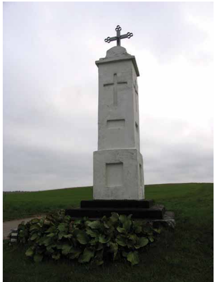
Mūro kryžius Tytuvėnų regiono parko teritorijoje.

Paruošus kalkes, būdavo mirkomas ašutinis teptukas (3 pav. 13 pieš.) ir juo balinama, braukiant ant sienos tik vieną kartą, kad neparuodėtų toje vietoje (jei braukiama daugiau, kalkės susimaišo su tinku ir toje vietoje paruduoja). Sienoms dažyti skirti teptukai dažniausiai būna trumpi, bet, dažant lubas, jį pririša prie ilgesnio koto. Balinama iki dviejų ar trijų kartų. Kai