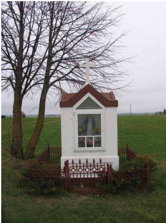
Mūrinė koplytėlė prie kelio Vaiguva–Pakėvis.