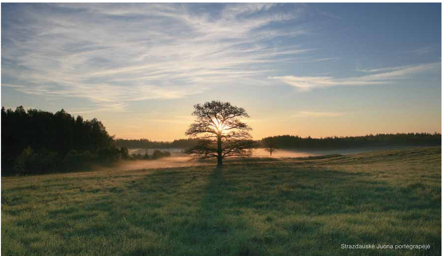
Strazdauskė Juona portėgrapėjė