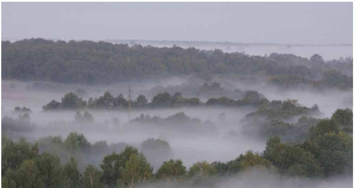
Strazdauskė Juona portėgrapėjė

kuokės jau kiaupīnės, ė napamačiau kāp išdīga-sužīda, mamunelė liūb rinks, šaltamė vundinie išmirkīs, uždies rūgšta pīna uždies ė līps valgītė su dūna, ka skuorboto nasėrgtomiem;