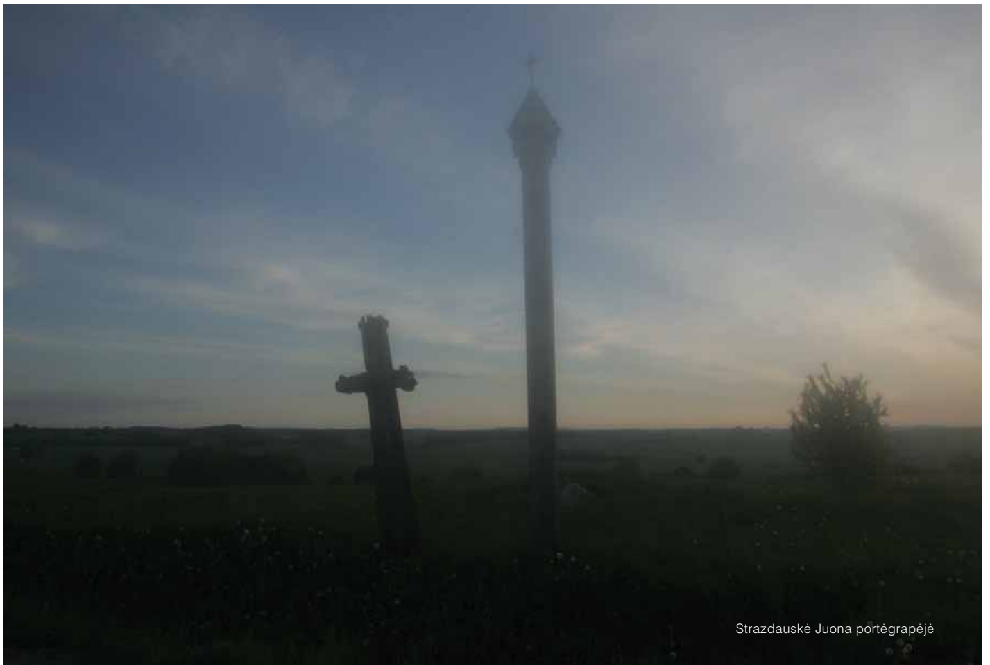
Strazdauskė Juona portėgrapėjė

Mėšks; kalba nomėškė garsū ėš tən pėlna atmintės, keitas, mainuos, vėrst i balsus, žuodė tī patis ė kėtė, kėtāp palėnktė, kėtāp skomb; ė žīd kėtāp tən balas balsus gėrdietus gėrdo-tabgėrdo, ė gražos mon ī tas gėrdiejėms, ta kalba nomėškė gėrda ė gėrda, kap tas mažas šaltėnoks pri mėška