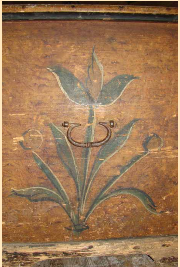
Platelių krašto baldų puošybos pavyzdžiai.