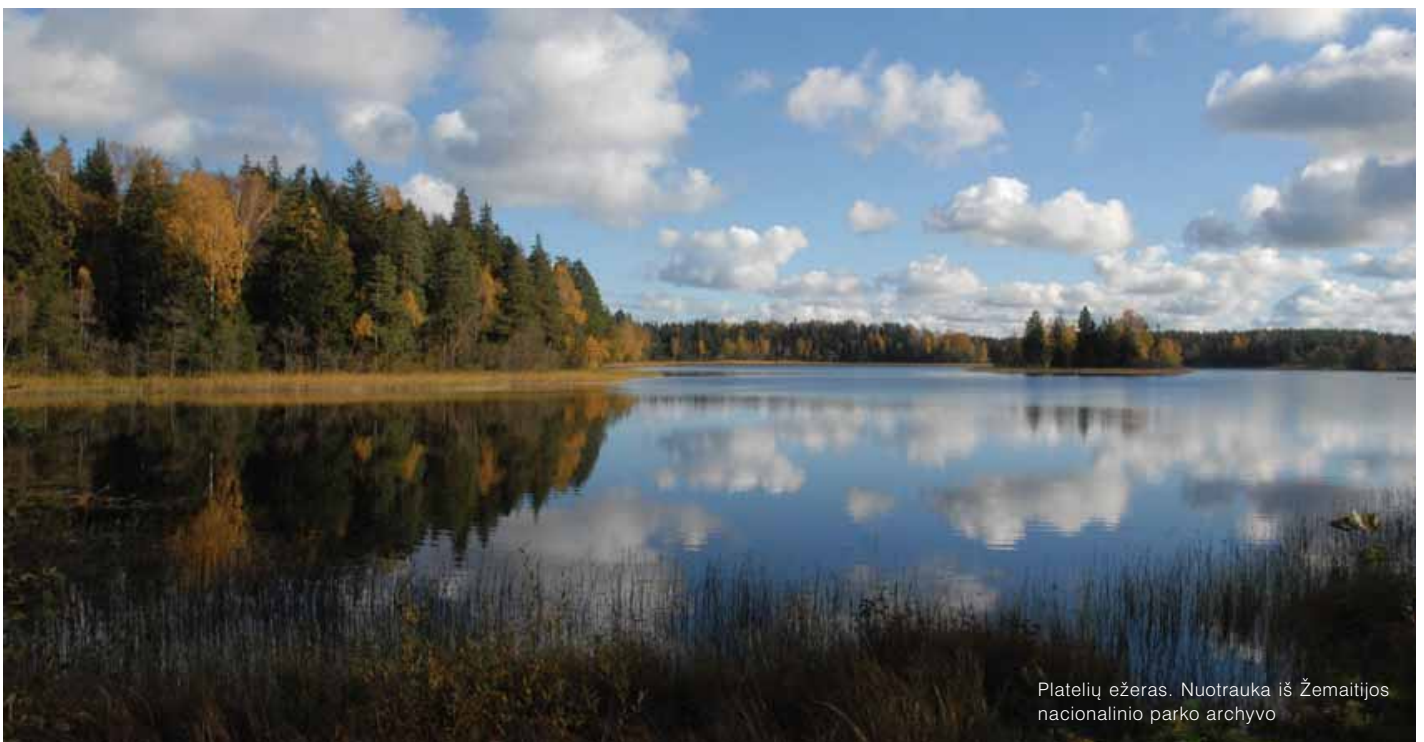
Platelių ežeras.