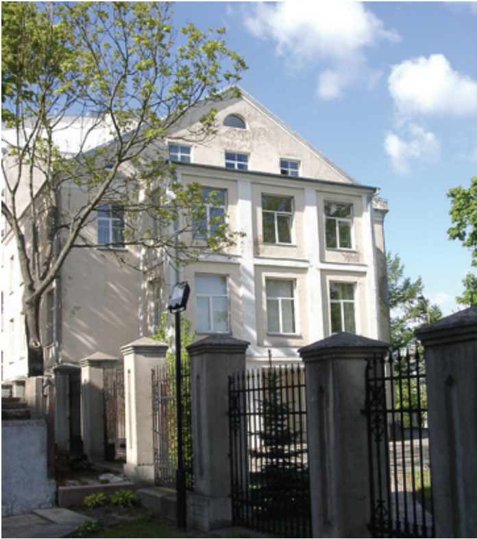
Telšiū konėgų semėnarėjė

1843 m. Telšė bova priskėrtė Kauna gubernėjė. 1853 m. oždarīts bernardinu vienuolĩns. 1864–1904 m. nemažā sosėpratusiu telšėškiu dalĩvava tautėnemė jodiejėmė, platėna ėr skaitė uždrausta lietuvėška spauda lotĩnėškās rašmenĩm. 1865 m. Telšiūs atėdarĩta pėnkiū klasiu bajoru mokĩkla.