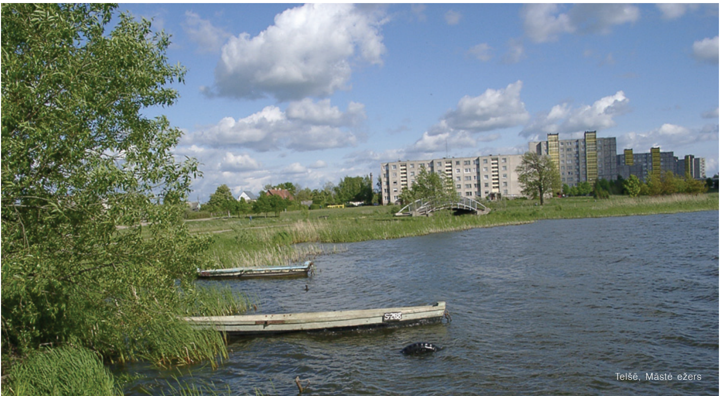
Telšė, Māstė ežers