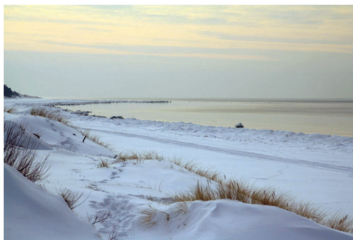
Tautavičiūtės Gretas portėgrapėjė

– Vo kū ten dērbā, oželi mona? Man dzig dzig, man dzig kuka, Cibai vasum vasavekum, Vasavekum vasavekum, Cibel gibel bimt.