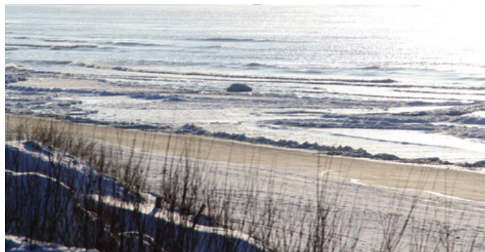
Tautavičiūtės Gretas portėgrapėjė

Nei aš tèn bovau, Nei aš tèn lakiuojau, Nei aš tèn pabaikštėnau Bierūsius žirgelius.