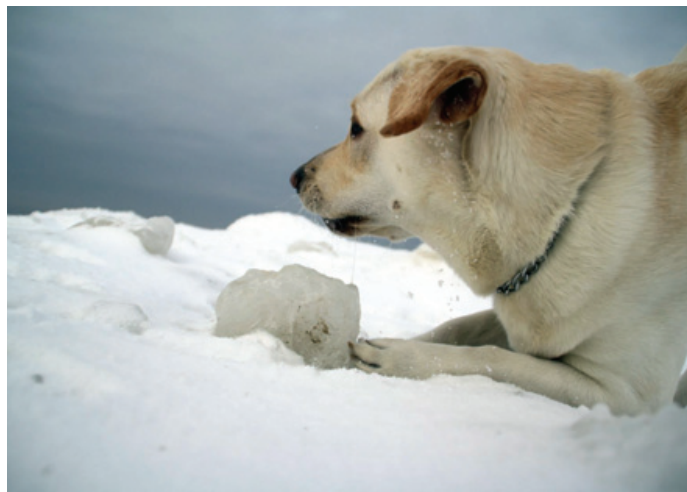
Tautavičiūtės Gretas portėgrapėjė