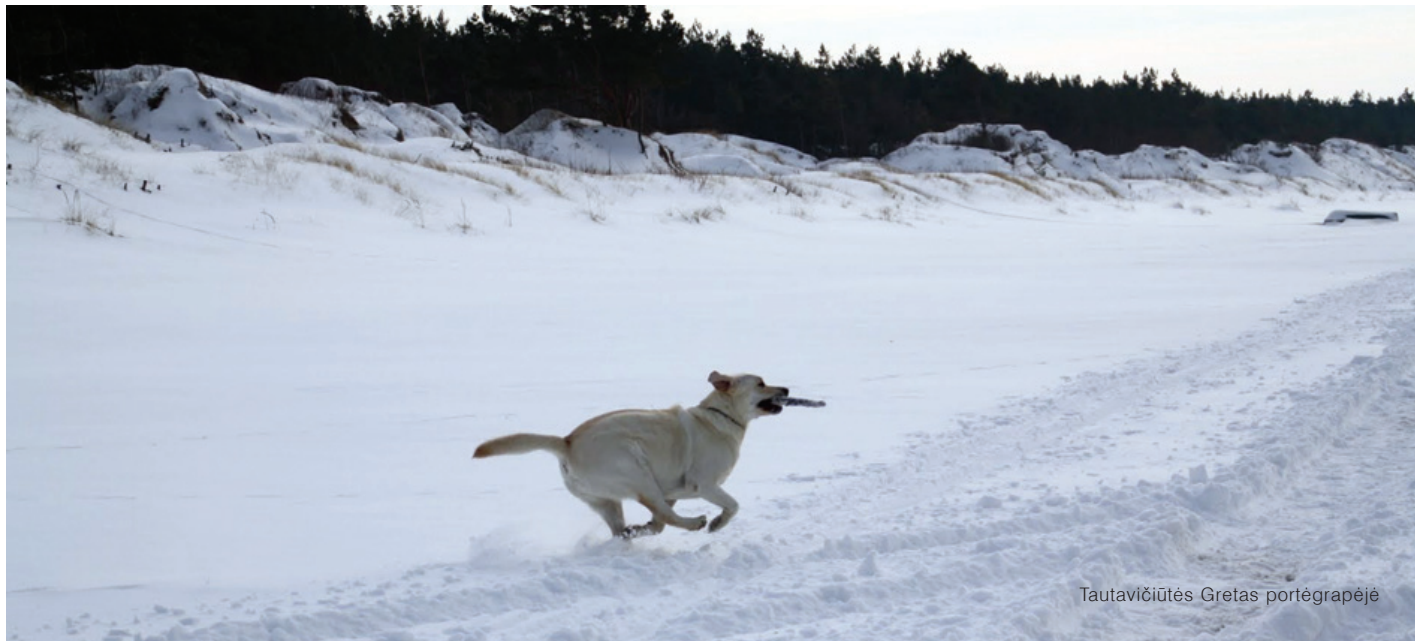
Tautavičiūtės Gretas portėgrapėjė

Saulelė nusiledo Už aukštū kalneliu, Sulaukiem gegožė Šelta vakarelė.