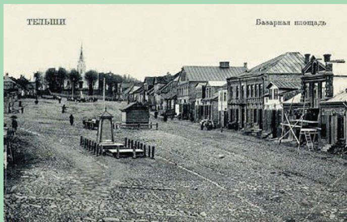
Telšiū torgaus aikštė XX a. pradiuo torgaus dėina. Ontroujė atvėrėlė išleida S. I. Zagelbauma kniņgu krautovė.

vuo kėti jau sok unt numū. Dėdoms tun vartu – pati kelma gali ivežti.