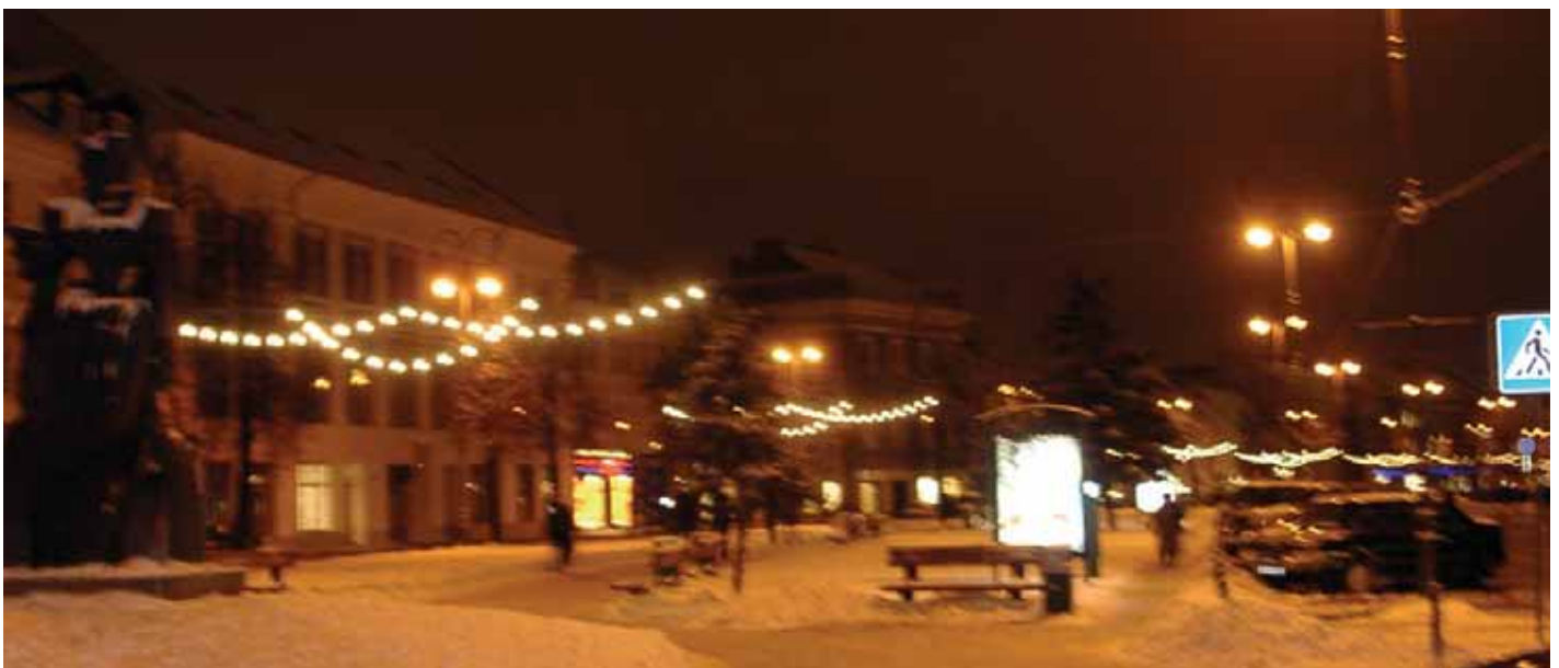
Kalėdų laukimu gyvena miestas...