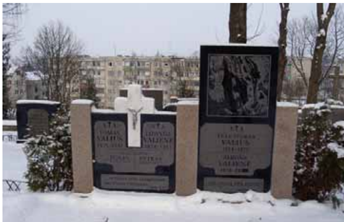
Kalėdų laukimu gyvena ir kapinės. Telšiai. 2006 m.