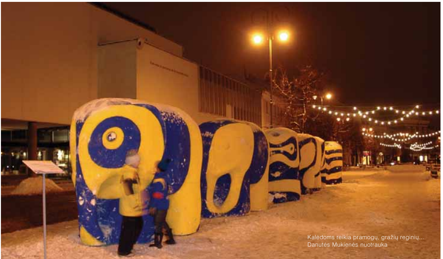
Kalėdoms reikia pramogų, gražių reginių...