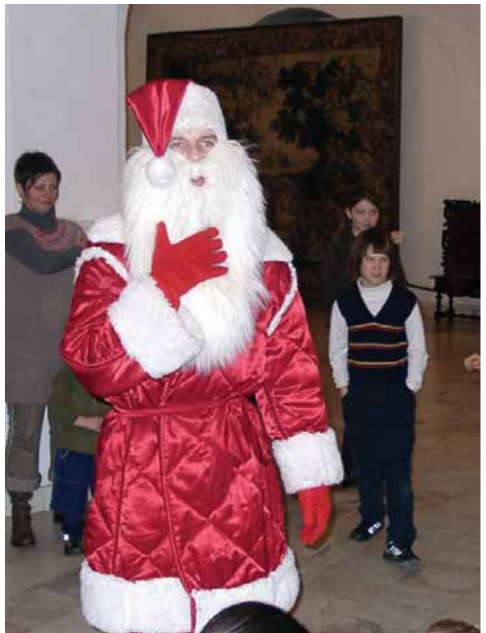
Kalėdos...

ta gali atverti daug paslapčių. Kūčių vakare žemaičiai, kad ir paprastieji ir nereikšmingieji įvykiams buvo labai jautrūs. Jie iš įvairių reiškinių spėdavo (burė) savo ateitį. Įvairūs žemaičių Kalėdų papročiai, burtai yra atėję iš pagonybės laikų. Žemaičiams priėmus krikščionybę, daugelis senovinių pagoniškų papročių, t. y. burtų bei prietarų, buvo pritaikyta katalikų gyvenime, taip pat ir švenčiant Kalėdas. Tai padėjo šiems senoviniams pagoniškiems papročiams, burtams ir prietarams išlikti iki mūsų laikų.