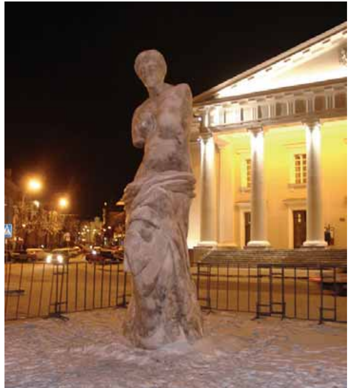
Ledo skulptūros kartais Kalėdų proga papuošia ir mūsų sostinę Vilnių.

Jei kavaličius (mergina) nori sužinoti, iš kurios pusės (ir kokią) merginą gaus, turi uždegti degtuką ir jį