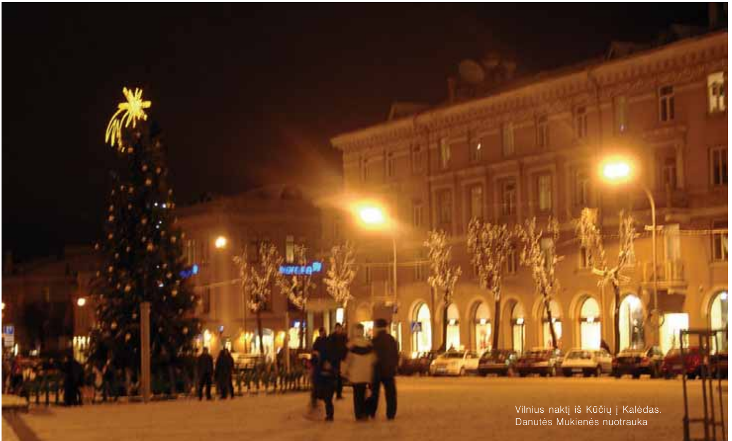
Vilnius naktį iš Kūčių į Kalėdas.