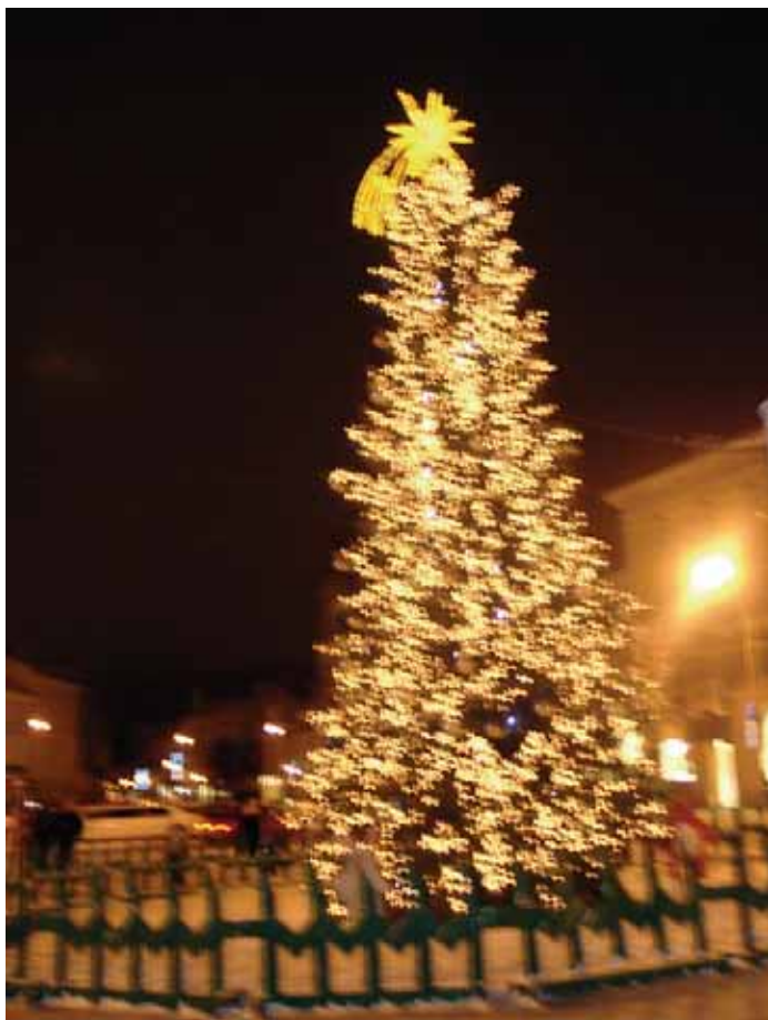
Kalėdų eglė uždegama šventės išvakarėse.