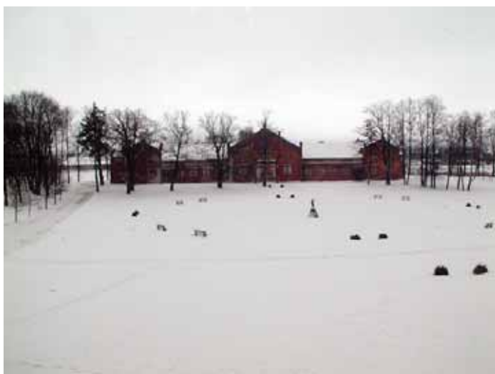
Lyg sniegas baltas skulptūros ant Plungės kunigaikščių Oginskių centrinių rūmų ir Plungės kunigaikščių Oginskių parko centrinis parteris žiemą.