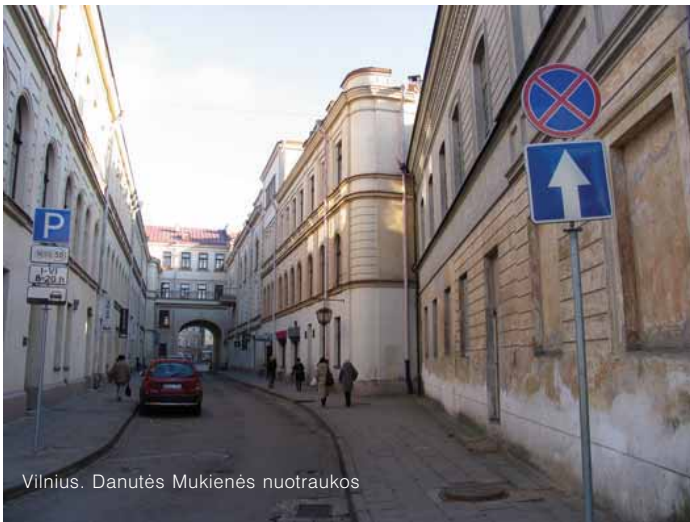
Vilnius.