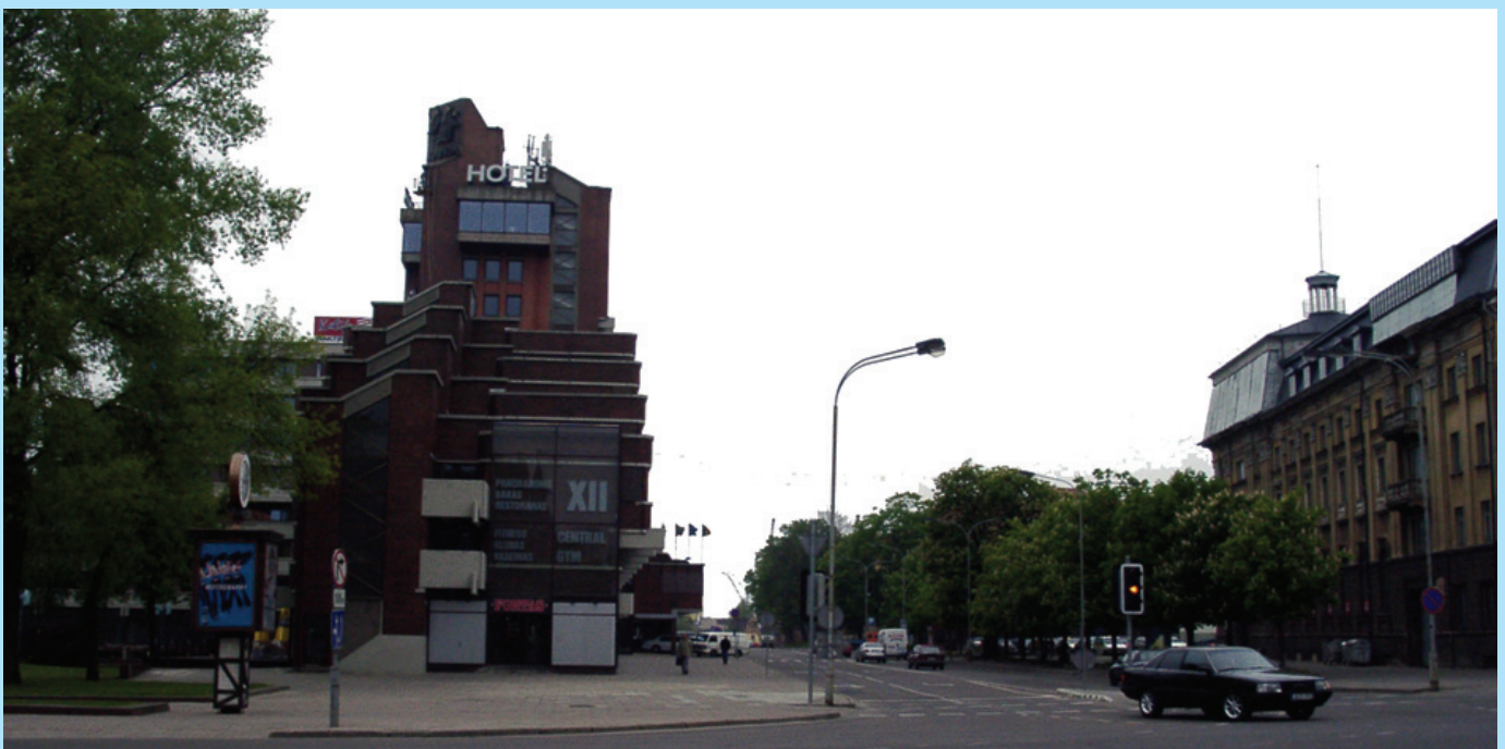
Viešbutis „Klaipieda“. Mukienės Danutės portėgrapėjē