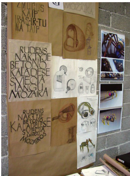
Vilniaus dailės akademijės Telšių dailės fakulteta studentu darbū peržiūruoms pateiktė darbā.