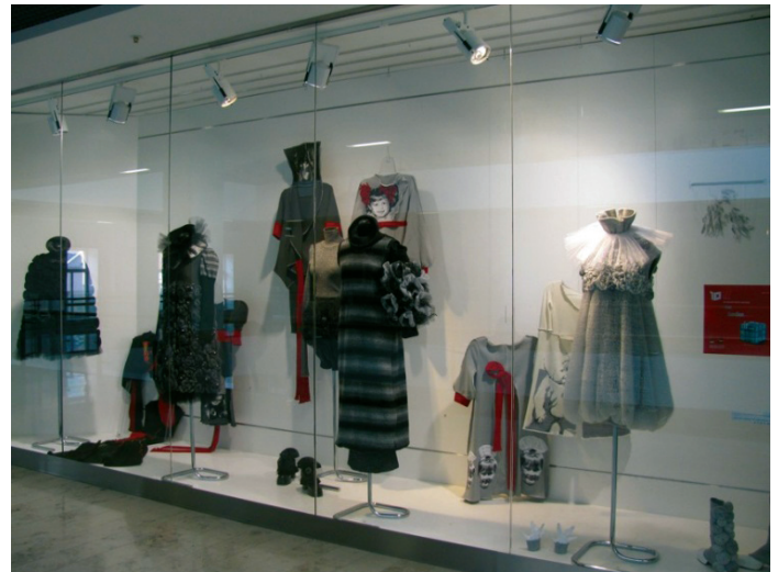
Vilniaus dailės akademijės Telšiū dailės fakulteta studėntu darbū paruoodus G9, veikosės 2009 m. lėipas 22 – rugpjūtė 20 d. Vilniou (Gedimina g. 9), skelbėms ėr tuos paruoodus fragmentės.

bakalaura studėju puogramas: kuostiuma dizaina (trikuotaža ėr rūbu dizaina), skulptūras (taikuomuoji skulptūra), dizaina (gamėnė dizains, baldū dizains ėr restauravėms, juvelėrika ėr kalvėstė).