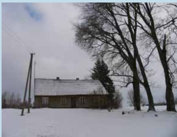
Vytauto Mačernio gimtinė žiema, 2006 m. Danutės Mukienės