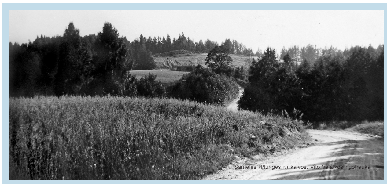
Sarneles (Plungės r.) kalvos.