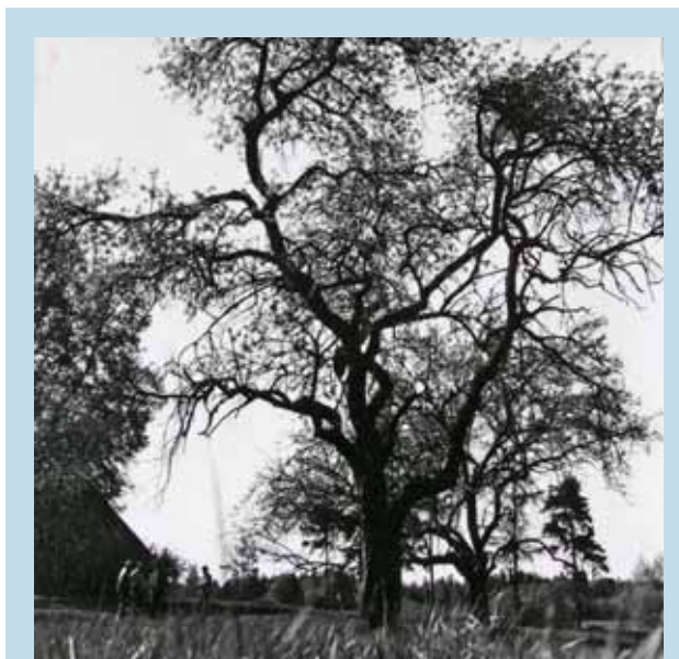
Vytauto Mačernio sodyboje.