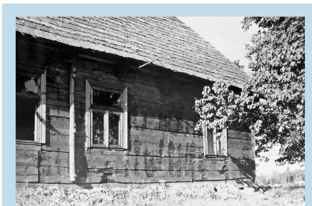
Vytauto Mačernio gimtojo namo fragmentai (matosi kambario,