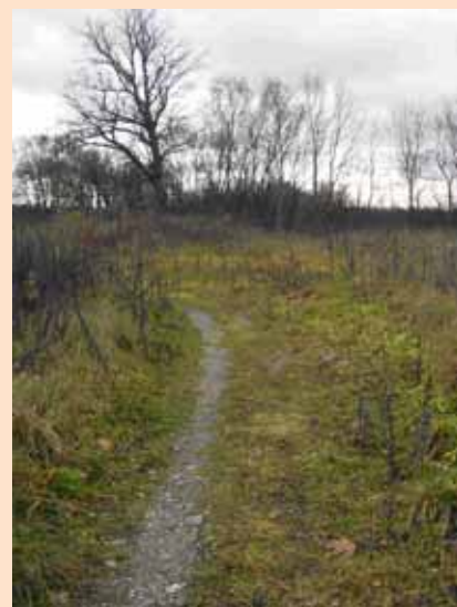
Iš kairės: dvarvietė šiandien (2008 m.); O takas ir šiandien veda į sodybą...