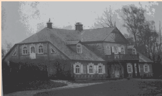
Dvaras XX a. ketvirtajame dešimtmetyje (1939 m.)

taip – „Širšynu“ – pavadino tikriausiai todėl, kad gyveno daug šeimų, beje, dažniausiai nekokių, nes tarybiniais laikais ten apgyvendino girtuokliaujančius, varganus žmogelius – šie patriukšmaudavo išgėrę, erzeliuodavo, pykdavosi kaip tikros širšės.